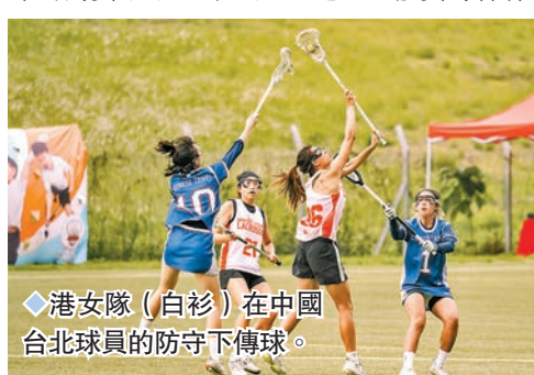
港女隊(白衫)在中國台北球員的防守下傳球。

港足球總會足球訓練中心舉行。中國香港男、女子代表隊，在首天的小組賽旗開得勝，男隊控香港男子精英訓練計劃隊及新加坡CrosseFire，女隊擊敗中國台北及韓國梨花隊，在小組賽排名暫列榜首。