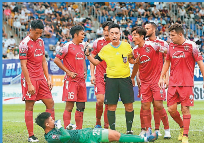
今季港超多次出現球證爭議判決，VAR實行後可望作出改善。