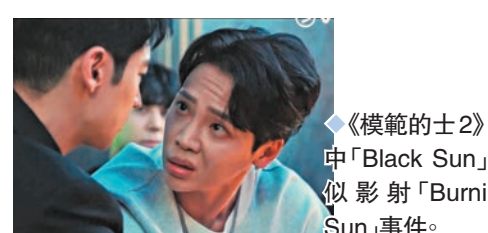
《模範的士2》劇中「Black Sun」疑似影射「Burning Sun」事件。