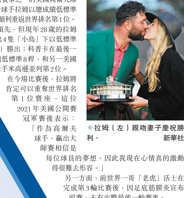
◆拉姆(左)親吻妻子慶祝勝利。

香港文匯報訊(記者 楊浩然)四大滿貫賽事之一的美國高爾夫大師賽於昨日結束最後一天賽事,西班牙球手拉姆以總成績低標準12桿勝出,個人二度贏出大滿貫賽事兼順利重返世界排名第1位。 美國球手科普卡在第3日比賽後保持領先,但現年28歲的拉姆在最後一天賽事表現更為出色,全日打出4隻「小鳥」下以低標準3桿完成,最終以總成績低12桿(276桿)勝出;科普卡在最後一輪比賽僅打出高標準3桿,最終以總成績低標準8桿,和另一美國球手米高遜並列第2位。 在今場比賽後,拉姆將肯定可以重奪世界排名第1位寶座,這位2021年美國公開賽冠軍賽後表示:「作為高爾夫球手,贏出大師賽相信是每位球員的夢想,因此我現在心情真的激動得很難以形容。」 另一方面,前世界第一哥「老虎」活士在完成第3輪比賽後,因足底筋膜炎宣布退賽,未有出戰最後一輪賽事。