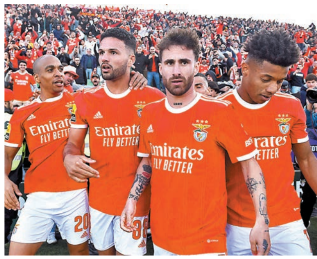
◆賓菲加今季表現依然穩定。 資料圖片

賓菲加在過去兩個轉會窗,分別將主力射手達雲紐尼斯和中場安素費南迪以億元身價賣走;當外界擔心這支傳統班霸會否因此無以為繼之時,賓菲加卻已憑藉他們出色的青訓和球探網絡,找到兩大主力的代替人選,首先現年21歲的中鋒卡路在上半年的世界盃已有過表現,在對瑞士隊時替葡萄牙隊大演「帽子戲法」,在他和23歲中場新星費羅倫天奴帶領下,賓菲加今季在葡超仍一枝獨秀,證明戰鬥力仍能維持,是役先有主場之利絕對值得信賴。