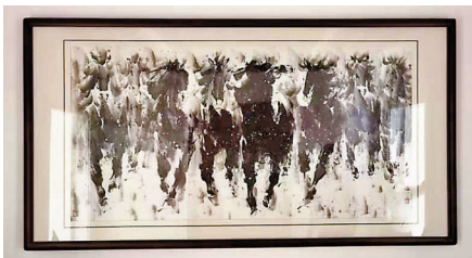
◆在畫家筆下，馬蹄翻飛處，往往是一片荒原。 明月如鏡高懸草原映照千年歲月 我的琴聲鳴咽 淚水全無 隻身打馬過草原

目擊衆神死亡的草原上野花一片 遠在這方的風比遠方更遠 我的琴聲鳴咽 淚水全無 我把這遠方的遠歸還草原 一個叫木頭 一個叫馬尾 我的琴聲鳴咽 淚水全無 遠方只有在死亡中凝聚野花一片