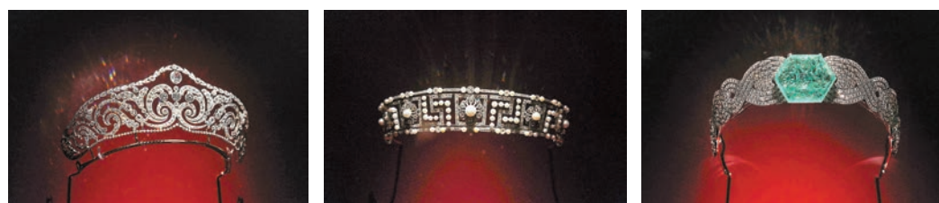
◆林青霞借出的冠冕。香港文匯報記者涂穴 攝 ◆劉嘉玲借出的冠冕。香港文匯報記者涂穴 攝 ◆何超瓊借出的冠冕。香港文匯報記者涂穴 攝

由林青霞借出的冠冕是她在60歲的生日宴會上所佩戴的冠冕，這是一頂1919年卡地亞的花環風格冠冕。劉嘉玲在眾多古董藝術品中亦對冠冕情有獨鍾，由她所借出的冠冕是一頂1906年卡地亞專屬訂製級別、鑲嵌天然珍珠與鑽石的希臘風格冠冕。