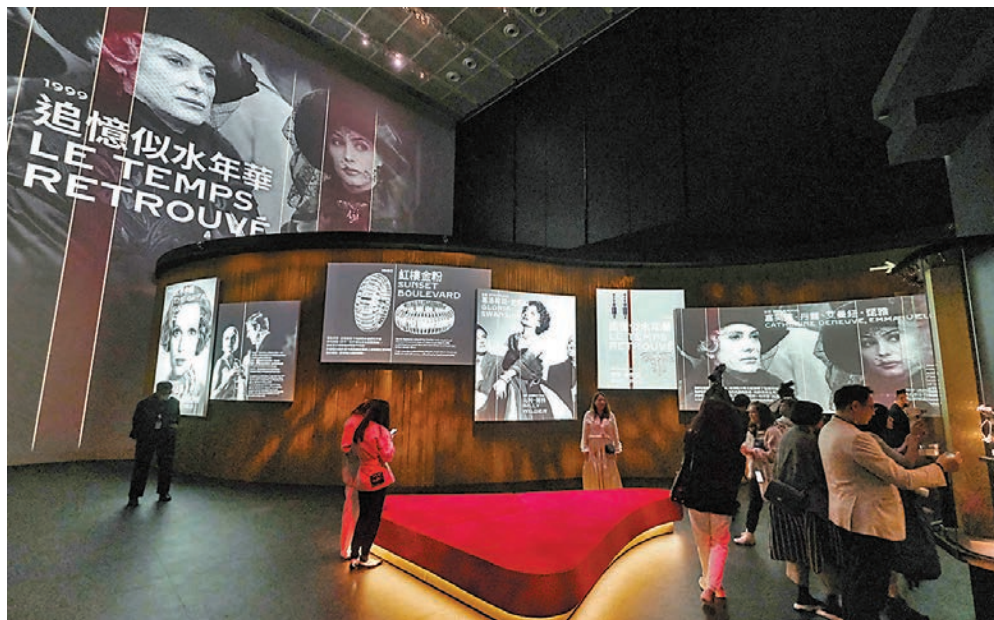
◆香港故宮文化博物館將於本周五至8月14日期間推出「百樣玲瓏——卡地亞與女性」特別展覽。

可參觀所有博物館展廳(包括「百樣玲瓏」展覽)的成人門票票價120元，特惠門票為60元，而博物館亦得到卡地亞贊助，將會為弱勢社群人士提供5,000張免費入場門票。