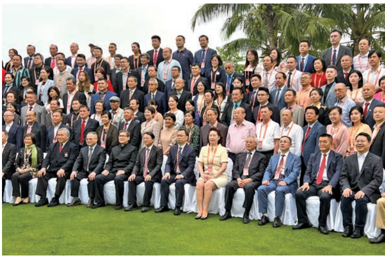
▲一年一度的南洋文化節日前在文昌市隆重開幕。