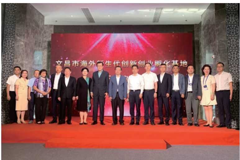
▲香港經濟航太考察訪問團出席文昌市海外新生代創新創業孵化基地揭牌儀式，見證這個引橋資、匯僑智、聚僑力的平台成立。

4月5日上午，訪問團來到洋浦展示館等地參觀考察；4月6日訪問團到文昌參觀考察，出席文昌市海外新生代創新創業孵化基地揭牌儀式，文昌市委書記龍衛東在致辭時表示，創建海外新生代創新創業孵化基地，着力打造集創新創業資源整合、項目孵化培育、成果轉化推廣於一體的綜合性平台。