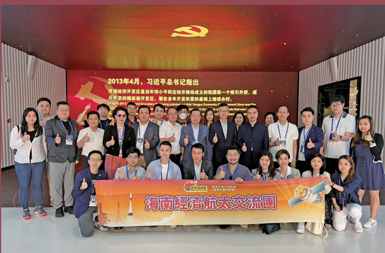
▲香港經濟航太考察訪問團是「交流·交往·交融」百萬青年看祖國主題活動在海南落地的第一個團。