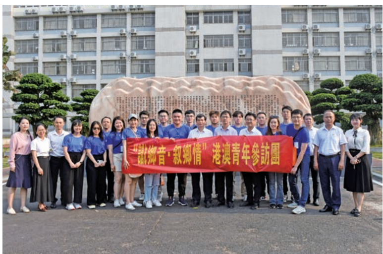
▲香港文昌社團聯會(香港文昌同鄉會)組織20名文昌籍港澳青年「識鄉音·敘鄉情」回鄉研學參訪團活動。

為深入學習宣傳貫徹黨的二十大精神，進一步引領香港青年融入國家發展大局。4月4日至8日，香港文昌社團聯會(香港文昌同鄉會)組織20名文昌籍港澳青年「識鄉音·敘鄉情」回鄉研學參訪團活動。