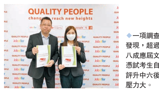
一項調查發現，超過八成應屆文憑試考生自評升中六後壓力大。

香港文匯報訊（記者 姬文風）中學文憑試（DSE）筆試將於本月21日起開考。有機構調查發現，超過八成受訪應屆考生表示升讀中六後壓力大，兩成半人自評壓力「非常大」，更有5%同學直言「完全不能夠」承受現有壓力。調查機構建議學校應多提供師友計劃予父母教育程度較低的學生，以減輕他們面對考試的壓力，又提醒家長多主動關心，並以朋輩模式與子女溝通，從旁協助子女渡過文憑試難關。 優才資源中心於去年11月至本年1月期間，以不記名問卷方式訪問了2,947位來自39間不同地區學校的應屆文憑試考生，了解他們在疫情影響下如何管理溫習時間及處理壓力。 結果發現，27%受訪者認為升讀中六後的壓力程度「大」，「較大」有30%，「非常大」有25%，而女生壓力程度一般較男生高。 78.7%女生因成績受壓 比率超男生 72.7%受訪學生認為壓力源於「考試成績」，「個人前途」和「個人期望」分別是62.6%和58.7%，「家人期望」為41.2%，可見學生給自己的壓力相對大。其中女生因為考試成績感到壓力的比率達78.7%，較男生高出11.6個百分點。 在壓力方面，64%考生認為在「很大程度上能