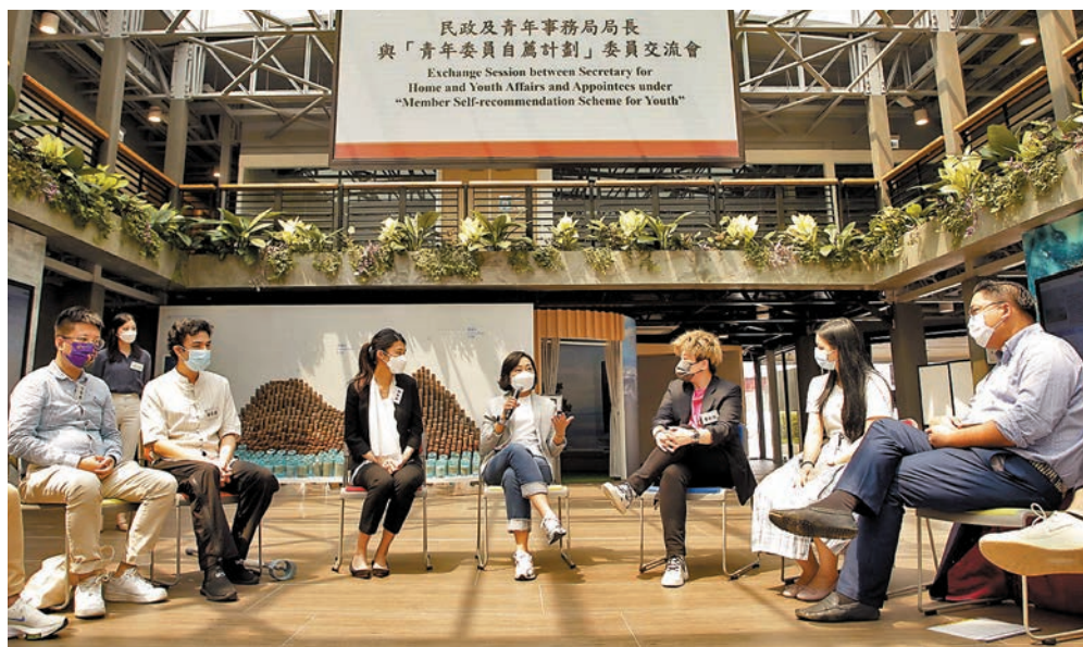
民政事務總署昨日公布，在全港18區成立「地區青年社區建設委員會」及「地區青年發展及公民教育委員會」。圖為去年9月，民政及青年事務局局長麥美娟（右四）與經「青年委員自薦計劃」獲委任的青年委員會面。資料圖片

「地區青年社區建設委員會」及「地區青年發展及公民教育委員會」由地區人士及自薦青年組成。委員會由20名至30名委員組成，整體平均年齡為35歲以下，其中超過三分之一是透過2022年施政報告宣布由民政總署推出的自薦計劃獲甄選成為委員的16歲至35歲青年。 委員由民政總署署長委任，任期由2023年4月11日至2025年3月31日止，成員名單已上載至民政總署網頁（www.had.gov.hk/tc/public_services/youth_participation_initiative/index.htm）。 「地區青年社區建設委員會」會就民政事務處指定的地區工程或設施項目及其他地區建設倡議提供意見，以及就民政事務處指定的地區工程或設施項目及其他地區建設倡議反映區內居民特別是青年的意見。