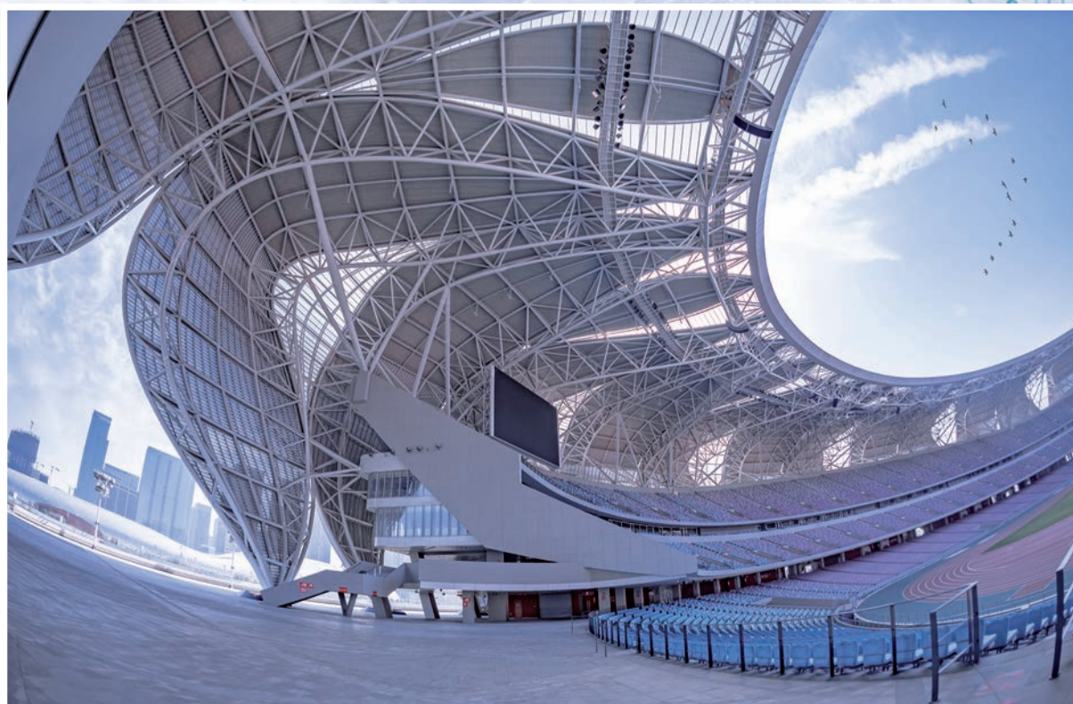
◆ 「智慧亞運」杭州亞運會奧體中心大蓮花內景