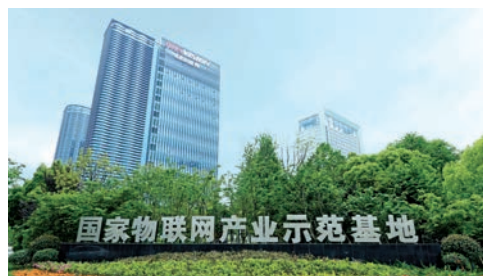
◆ 國家物聯網產業示範基地

杭州電子商務服務、雲計算、數據治理、第三方支付能力居中國之最，杭州跨境電商試區、浙江自貿試驗區杭州片區發展位列全國第一梯隊。杭州首創的城市大腦覆蓋了警務、交通、城管、文旅、衛生等11大領域。杭州首創的「健康碼」作為數字抗疫神器仍在發揮重要作用，其第一行代碼被國家博物館作為首個數字藏品進行收藏。2022年，杭州聚焦智能物聯產業，實施「1248」計劃，提出高水平重塑全國數字經濟第一城。2022年，杭州數字經濟核心產業增加值突破5000億元，佔全省比重約57%，佔全市GDP比重超過27%。