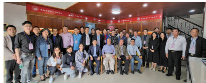
到訪揭陽港澳人士聯誼會與成員合照