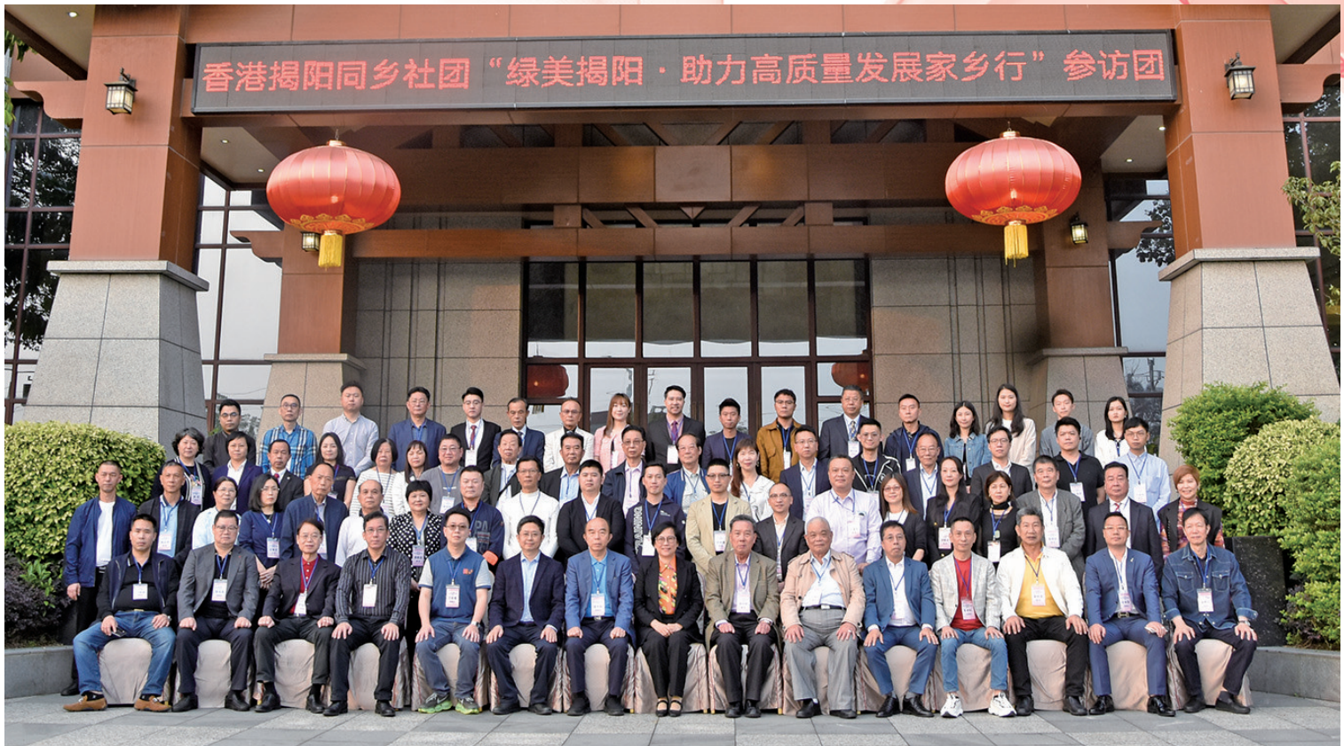
4月7日，「綠美揭陽·助力高質量發展家鄉行」參訪團全體成員與揭陽市委市政府領導大合照。