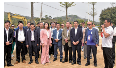
考察惠來縣華湖鎮白塔村新農村建設