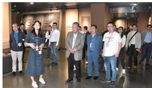
參觀揭陽市博物館