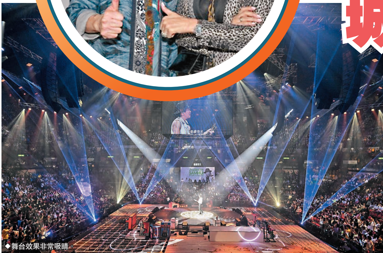
舞台效果非常吸睛。

據大會透露，雖然今次大部分門票也是賣$380，實行賣大包，但製作費完全沒有縮減。舞台搭建成Sam的家，觀眾聽他唱歌發放正能量，Sam自己亦帶了四支私伙結他配合不同的歌曲演奏；樂隊連和聲便有13人，負責弦樂的樂手也有12人，單是音樂部分便共有25人之多；負責Sam和舞蹈員服裝設計的是大師陳華國，他為Sam和舞蹈員們分別設計了7套各具特色的衣服去配合演出部分之主題；而舞蹈總監更是郭富城御用排舞師Sunny Wong，演唱會內容可謂聲、色、藝俱全，難怪今次演唱會迅即成為城中話題。