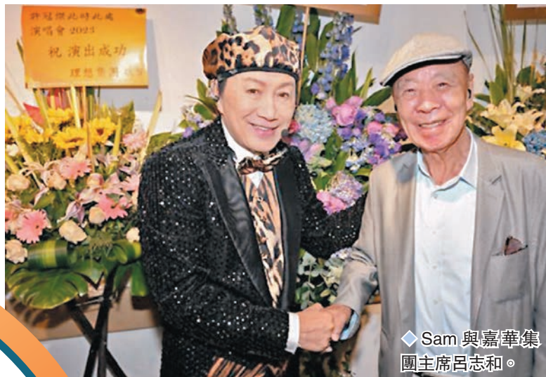
Sam與嘉華集團主席呂志和。

香港文匯報訊(記者阿祖)第5場「許冠傑此時此處演唱會2023」已在前晚(11日)圓滿完成。儘管經過了前4晚超過12小時又唱、又跳、又彈多種樂器的演出，Sam的精力好像永遠也用不完似的，他在舞台上精彩的表演令全場觀眾，包括特別前來捧場的嘉華集團主席呂志和、劉嘉玲、樂易玲、上山詩鈞和張德蘭夫婦等名人拍爛手掌。