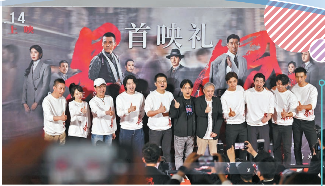
◆《暴風》主創們前晚到廣州出席首映禮。