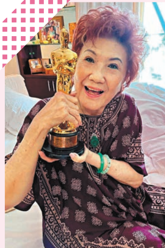
◆楊紫瓊將「小金人」獎座給其母拍照。