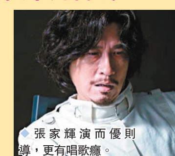
◆張家輝演而優則導，更有唱歌癮。

香港文匯報訊(記者 阿祖)張家輝自導自演的最新作《贖夢》，自2月拍竣後一直做後期製作，昨日首張電影海報正式登場，兩位男主角家輝及劉俊謙造型亦隨之首度曝光。海報罕有以泥黃色作主調，別有一番意境，配上破碎鏡子被線勾起，象徵兩位主角憶起前塵往事，海報上面亦寫上「救贖心靈，傷痕累累(蒙蒙)」，意味角色在命運路途相遇，互相牽引交纏。而海報背景音樂由家輝重新演繹當年王傑作品《今生無悔》作為電影宣傳曲。今次家輝除了擔任創作和演出崗位外，亦親自翻唱歌曲。對上一次家輝唱歌，已是2015年《陀地驅魔人》翻唱汪峰的《你是我心愛的姑娘》，這次亦是相隔8年後，家輝再次為電影作品獻唱，成為電影中另一賣點。