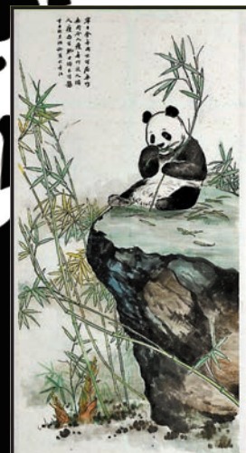
◆《寧可食無肉不可居無竹》，65×127cm