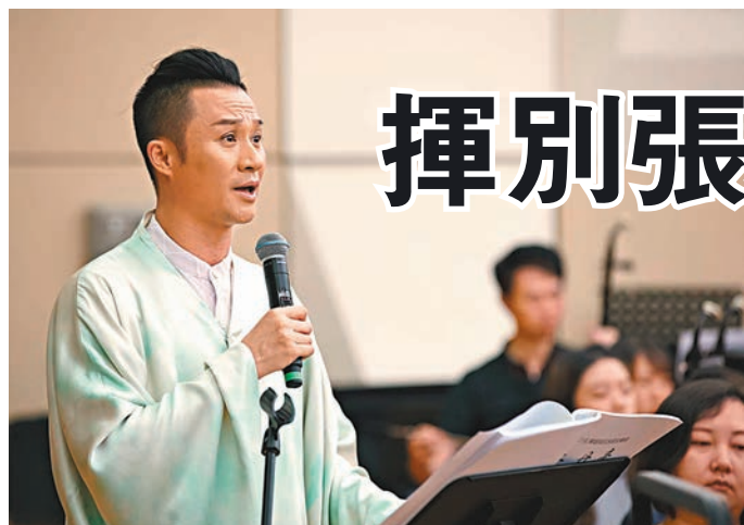
◆張軍早前曾赴香港與中樂團合作演出。 資料圖片