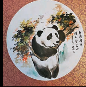
◆《堅持 撐住 明天會更好》，27.3×24.1cm

近年，她的學生愈來愈多，水墨也成為因疫情無法外遊的港人紓壓的方式之一。她讚許香港具有獨特文化氛圍，認為香港正是傳揚水墨的良好藝文平台，而這也與政府大力度支持舉辦文化藝術活動的措施密不可分，「我覺得現在是一個很好的時機，開啟大家對中華文化的再認識、再學習、再創造、再發揚。」