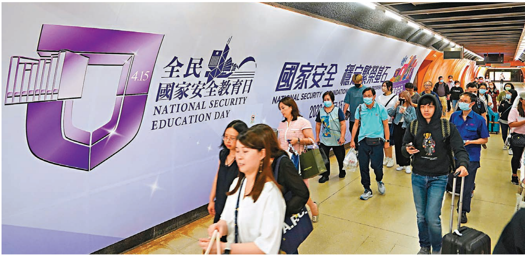
◆多位代表、委員引述，夏主任強調要加強警惕外部勢力滲透、顛覆等危害國家安全活動。圖為市民經過「全民國家安全教育日」宣傳海報。

全國僑聯副主席盧文端在會後表示，夏寶龍主任務實、做事貼地。會面期間，夏主任主要聆聽，其間有13名與會者發言，「個個都好有代表性。」大家提到許多民生議題，包括港鐵票價、「房屋問題成日嘍度拖」等。他期望中央能加強支持香港，解決香港目前面對的民生問題。