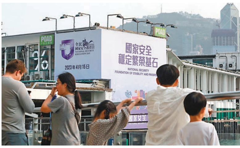
◆今年「教育日」的主題為「國家安全 穩定繁榮基石」。

香港文匯報訊(記者 藍松山)由香港特區維護國家安全委員會主辦的「全民國家安全教育日」開幕典禮暨主題講座，今日在香港會議展覽中心大會堂舉行。今年「教育日」的主題為「國家安全 穩定繁榮基石」，旨在提高全港市民維護國家安全的意識和責任感。各界人士將聚首一堂，為「教育日」一連串的精彩活動主持啟動儀式。