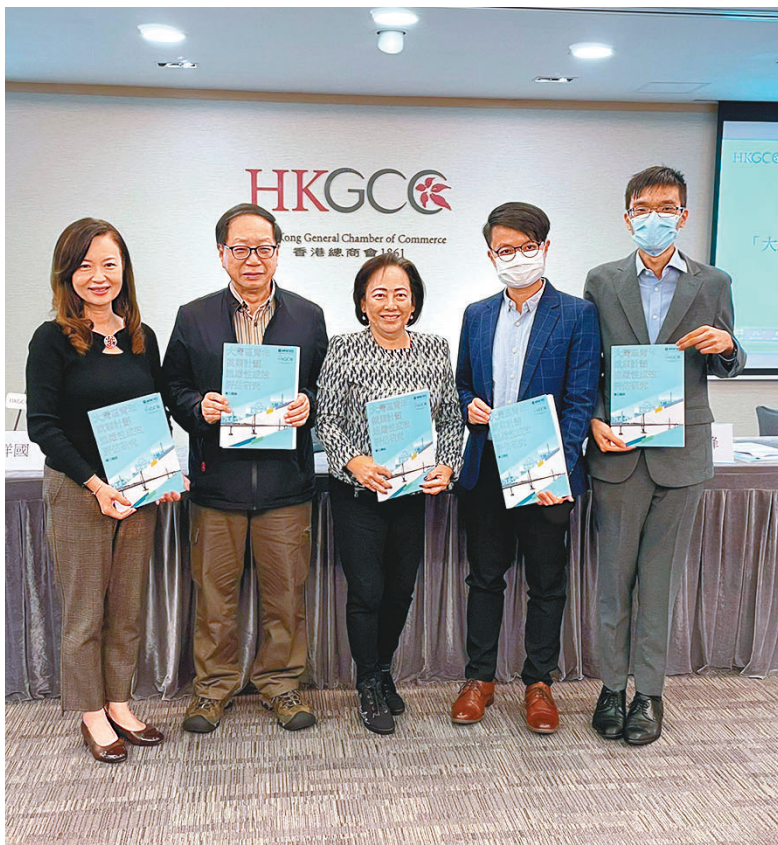
◆香港總商會聯同MWYO青年辦公室的調查指，僱主及僱員對「大灣區青年就業計劃」的成效感到正面。