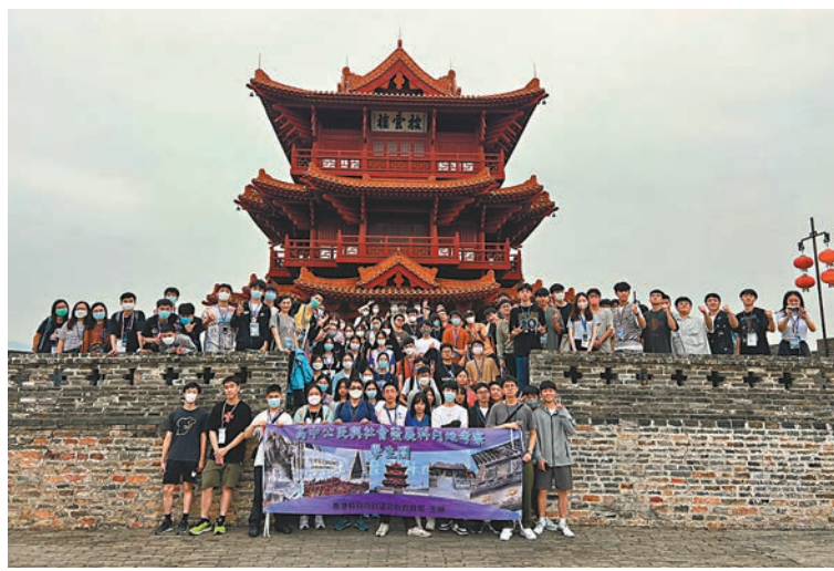
◆交流團在肇慶古城牆合影。