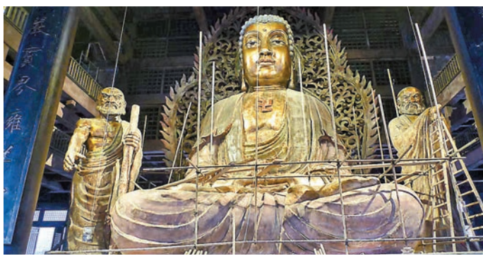
◆鍾劍偉團隊為電影《新少林寺》製作的佛像。