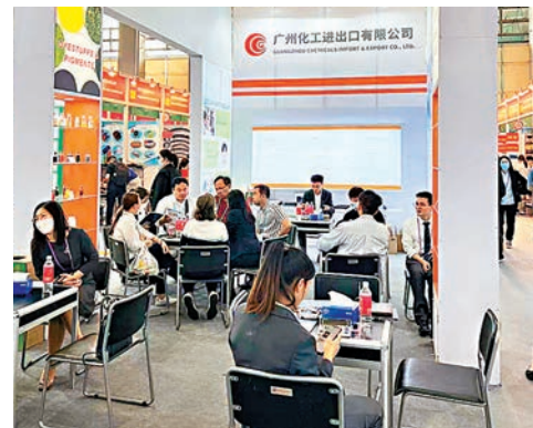
廣州輕工集團旗下品牌展位。