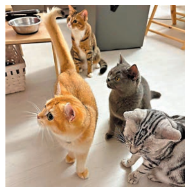
◆涉案派對房間作招徠的7隻「鎮店之貓」被取走。

香港文匯報訊（記者 蕭景源）葵涌一間以提供人貓互動作招徠的派對房間發生懷疑偷竊貓事件。昨凌晨男負責人返回派對房間時，發現7隻心愛「鎮店之貓」連同兩個寵物袋一併不翼而飛，於是報案。警方經初步調查後，不排除負責人的前女友與案有關，列作「盜竊」案跟進，暫未有人被捕。