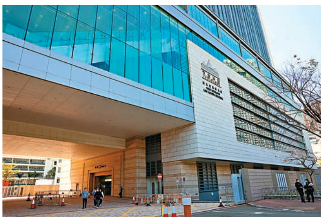
◆西九龍裁判法院日前發生「掉包」越押案。 資料圖片

香港文匯報訊（記者 葛婷）西九龍裁判法院周一（10日）發生「掉包」走犯案，越押的販毒案男疑犯於周四（13日）在油麻地被捕，昨日被押解到法院提堂，被加控一項「誤導警務人員」罪及一項「從合法羈押逃離」罪。裁判官應控方要求將案件押後至5月25日再訊，以等候進一步調查，包括翻查閉路