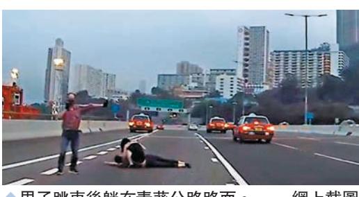
◆男子跳車後躺在葵青公路路面。

友當時蹲在男子身旁，而涉事的士司機站在旁邊一邊打電話報警，一邊揚手示意途經車輛小心避開，但未有擺設任何警告物提醒駕駛者。其間有一輛的士駛至，一度要急扭右軚閃避，幸鄰線沒有車輛駛至，而拍攝該「車Cam」影片的私家車司機忍不住說：「晨早流俾佢嚇死，好彩得切。」