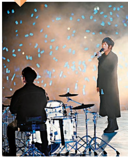
五月天想念港迷的尖叫声。

蛋仔模型送上台，讓五月天一解美食情愁。搞笑是在芸芸紙牌當中，台下竟有一名女觀眾除了高舉五月天的紙牌，還同時舉起韓國女團BLACKPINK的毛巾和紙牌，阿信笑問：「這是什麼意思？你是不是跑錯演唱會？」並與隊友一同笑稱不會理會對方的點唱。未幾又看到有觀眾點唱周杰倫的《開不了口》，今次阿信唱了兩句，再笑問：「究竟你們是誰的粉絲？」看到有觀眾的字牌寫着「上次來香港的冠佑46歲」，輪到瑪莎發功，打趣指冠佑是愈來愈年輕的，因對方的笑話愈來愈幼稚。阿信接口說：「五月天沒有忘記大家，除了為你唱，還會陪你哭與笑，也許有一天冠佑超過46歲和66歲都一樣地唱，大家是否都會前來，但那時候可能只有100個人或是10個人，不過就算只有一個人也真的為你唱！」完場時，歌迷熱情地自發用螢光棒製造「人海」及狂叫安哥，令五月天也感動得三度安哥，最後再全場大合唱《戀愛ing》，台上台下才依依不捨地離開。