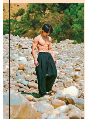
林宥嘉赤膊上身、徒步赤腳拍MV。

林宥嘉對MV初步的概念，希望以一顆石頭代表負面與阻礙，並以不斷搬開石頭來表現愛。他首次在螢幕前展現好身材，大方分享健身秘訣是堅持以211飲食法搭配規律的運動達成，為拍MV更是特別嚴格控制飲食並加強訓練3個多月。原來過往林宥嘉因壓力過大罹患腸躁症，又檢查出器官嚴重發炎，身體健康亮紅燈，體重狂掉四五公斤。去年他透露醫稱這個病「無法根治」，為免刺激腸胃，能吃的東西非常少，只能吃肉、小黃瓜、馬鈴薯、紅蘿蔔還有藍莓，讓他一度覺得是「與死亡最近的一次」，因此他控制飲食防止腹瀉，在太太丁文琪的照顧下，靠着飲食、健身重拾健康。