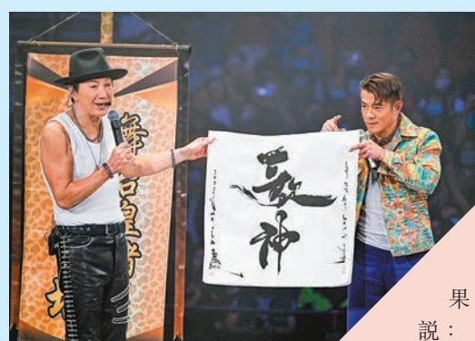
城城預備了寫上「歌神」的墨寶回敬許冠傑。

為秉承慈善理念，大會向多個慈善機構送出慈善直播通行證，當中超過 40 個院舍參與直播，觀看直播的受眾超過 1,500 人，讓大眾一起享受音樂，互相打氣，為社會注入正能量。