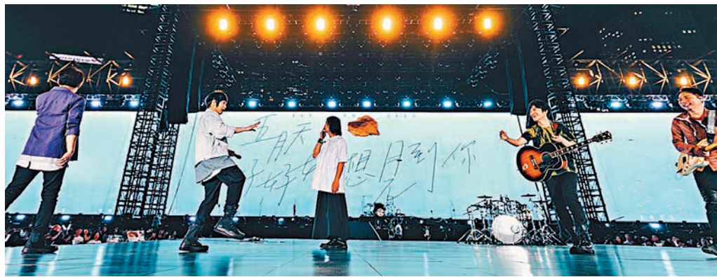
歌迷將大型雞仔模型傳到台上，五月天玩得投入。

香港文匯報訊（記者 子棠）台灣樂隊五月天前晚在中環海濱活動空間為共6場的《好好好想見到你演唱會》揭幕，請來白安擔任表演嘉賓，並得到成龍、張學友、劉德華、任賢齊、謝霆鋒等送花籃祝賀。受疫情影響，原定每年來港開唱的五月天今次要相隔4年才能重臨香江，五位成員阿信、怪獸、石頭、瑪莎和冠佑禁不住訴說對香港的「相思」，但現場卻被人「踩場」？