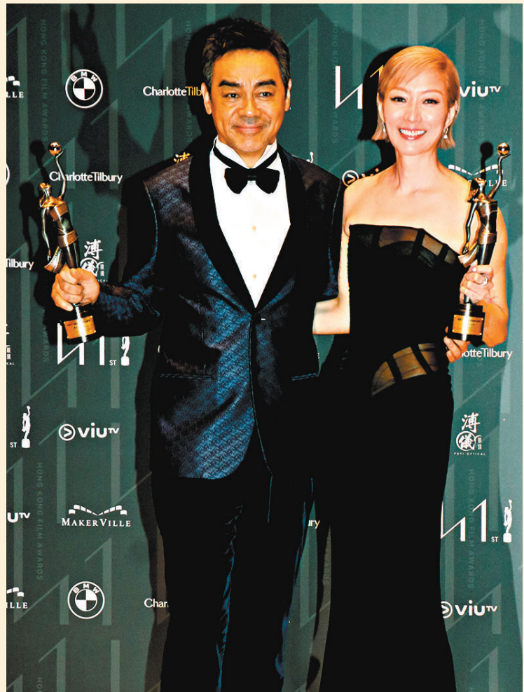
◆出爐影帝影后劉青雲、鄭秀文分享喜悅。