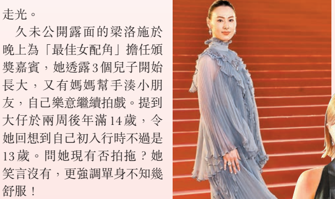
◆梁洛施擔任頒獎嘉賓。