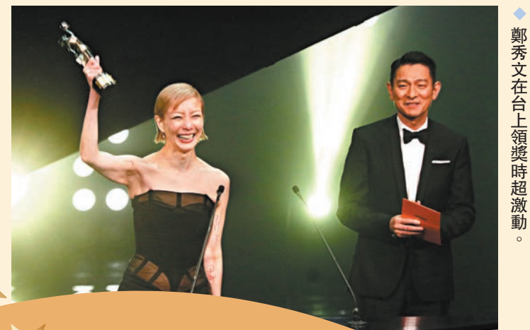
◆鄭秀文在台上領獎時超激動。