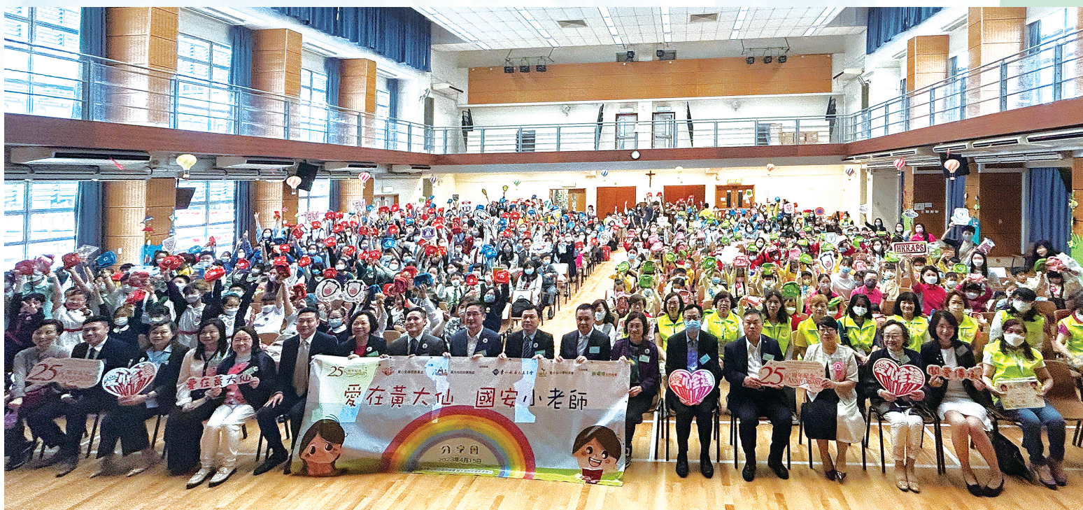
▲「愛在黃大仙 國安小老師」分享會在黃大仙的嘉諾撒小學（新蒲崗）成功舉辦。