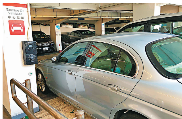
◆政府停車場最快於今年下半年起逐步徵收電動車充電費。資料圖片

他同樣認為，收費金額應以收回成本為目標，每度電收費不應超過兩元，又希望政府停車場內的充電設施能以快充為主，相信可以加快充電車位的流轉。