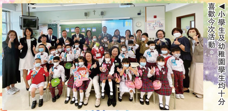
▶小學生及幼稚園學生均十分喜歡今次活動。