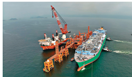
◆浮式儲存再氣化裝置船停泊於海上液化天然氣接收站，配合接收站的最後整體調試。

香港文匯報訊（記者 費小燁）中電與港燈昨日共同宣布，早前抵港的浮式儲存再氣化裝置船（下稱「儲氣船」）已完成相關檢查及入境手續，昨日順利停泊於香港西南水域的海上液化天然氣接收站，以配合接收站的最後整體調試。