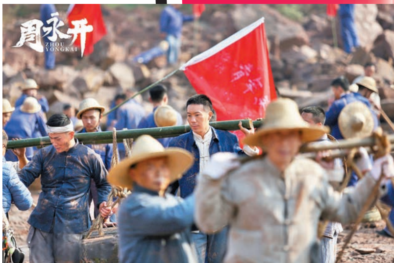
影片展現周永開與勞動人民共同奮戰的場景。