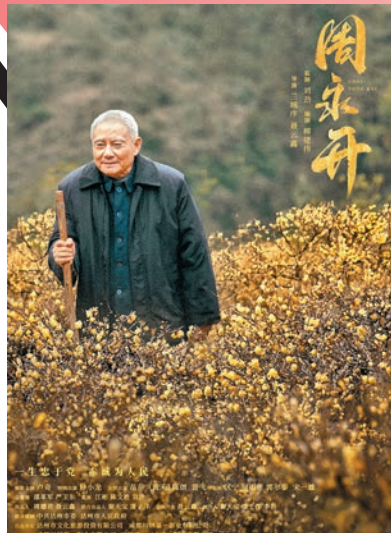
周永開離休後走進花萼山護林修路。

以「七一勳章」獲得者、全國優秀共產黨員周永開為原型攝製的主題電影《周永開》日前在四川成都舉行首映儀式。影片以周永開真實生活、坎坷經歷、感人事跡為創作基礎，圍繞他的四個人生階段，以講故事的形式從不同側面展示他的高尚品質和傳奇人生，在銀幕上生動鮮活刻畫出一名黨員無論在何時何地都始終「不忘初心、牢記使命」「一生忠於黨，赤誠為人民」的崇高品格和為民情懷。