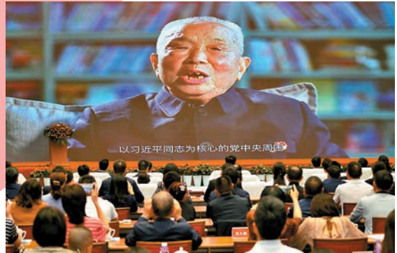
周永開在首映儀式上通過視頻致辭。

影片結尾呈現出溫馨感人的一幕：離休後的周永開有次到廈門參加活動，他為愛人特地帶回了滿滿一瓶海水，「因為愛人一輩子沒有見過大海」。最後，滿頭銀髮的周永開夫婦還拍了一張婚紗照，彌補了夫妻