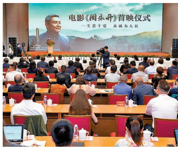
電影《周永開》日前在成都舉行首映儀式。