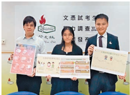
◆學友社調查發現，今屆考生的壓力水平明顯較過往數屆考生低。

教育局局長蔡若蓮昨日就在 Fb 專頁送上兩首分別由「譜出聲藝」音樂比賽及「英文馮語」創意歌唱比賽的得獎同學主唱的勵志歌曲《Timeless》及《自強不息》，希望考生們聽歌減壓。