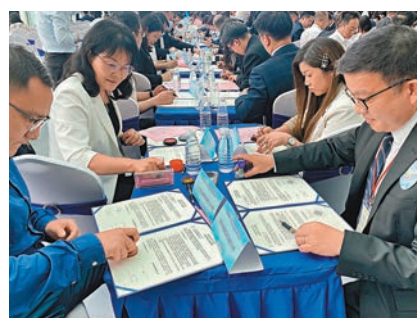
◆129 對粵港姊妹學校締結簽約儀式。

在昨日參與簽約儀式的香港學校中，約一半是首次加入姊妹學校計劃，藉以與內地深化交流。香港特區政府教育局副局長施俊輝致辭時表示，目前香港與內地締結的姊妹學校達 2,300 對，以粵港姊妹校規模最大，佔超過六成。局方今年的目標，是讓兩地姊妹校總數再增加約 10%，還會協調及籌辦包括「粵港姊妹學校中華經典美