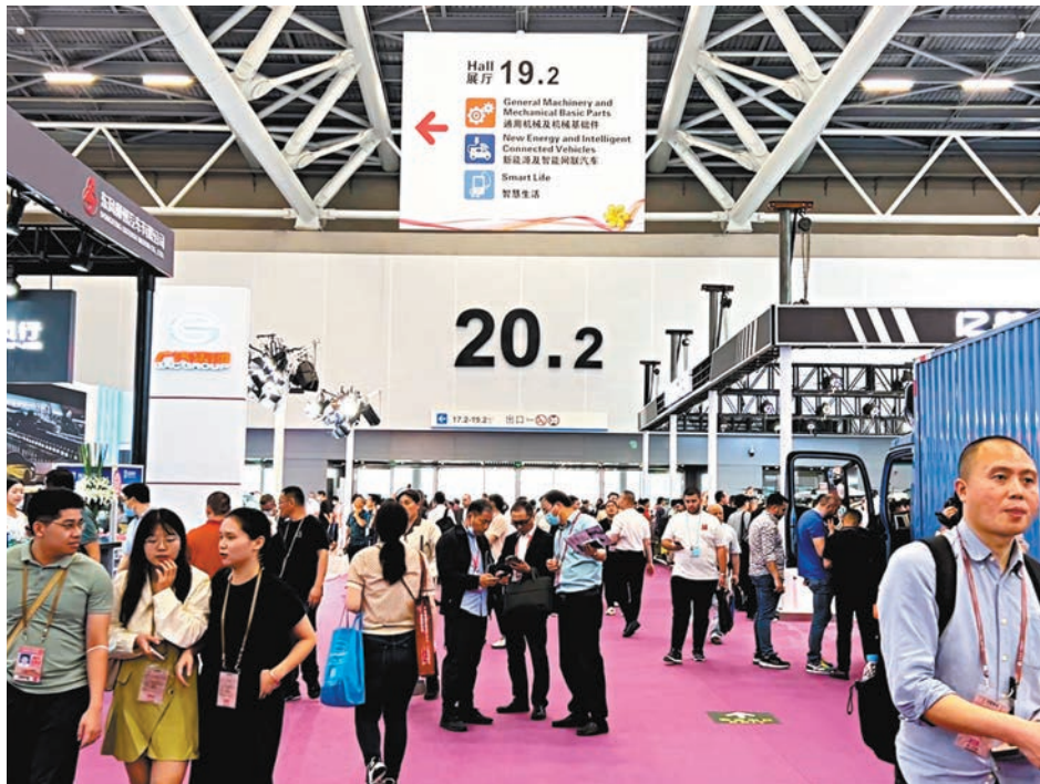
圖為廣交會智能網聯汽車及智能網聯汽車展區。