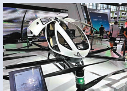
載人級自動駕駛飛行器EH216-S