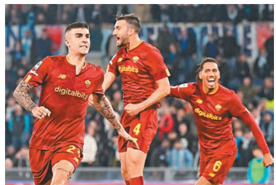
羅馬有力在主場反勝晉級。

同時間士砵亭主場對祖雲達斯比賽(now645台周五3:00a.m.直播)；士砵亭首回合落後0:1，是役自然希望憑藉主場之利反勝；不過祖雲達斯明顯期望借助歐霸盃冠軍名義取得來季歐聯資格，故在近兩輪聯賽皆有留力之嫌，養精蓄銳下出訪葡萄牙仍有望全身而退。