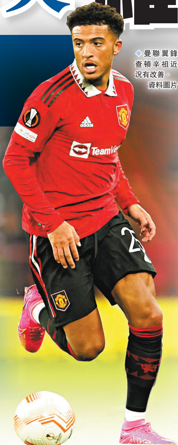
曼聯翼鋒查頓辛祖近況有改善。資料圖片