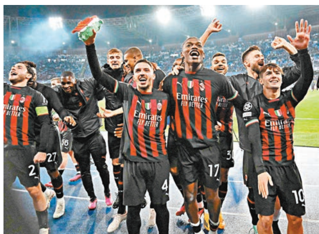
AC米蘭球員賽後和球迷慶祝。