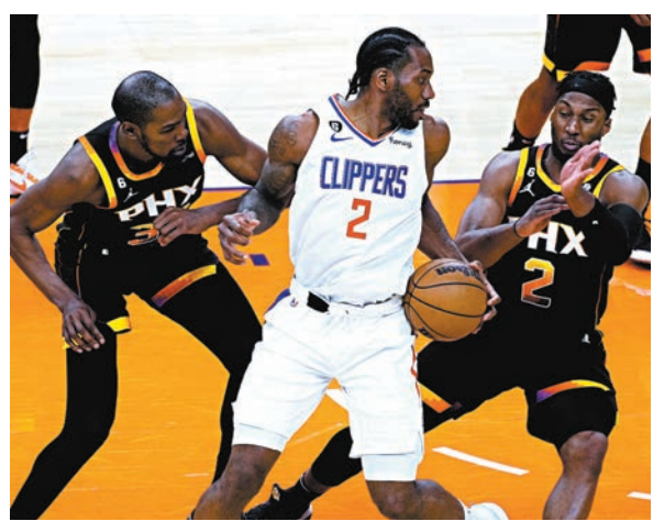
太陽以二人夾擊快艇主力李奧拿德(中)。

至於塞爾特人對鷹隊比賽，塞軍最終憑主力積遜達頓和戴歷克懷特分別取得29分和26分，主場以119:106取勝，總場數領先至2:0。