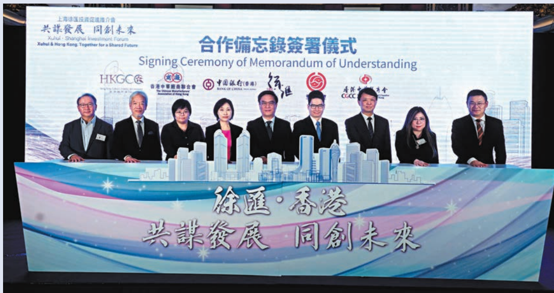
圖為上海徐匯投資促進推介會合作備忘錄簽署現場。