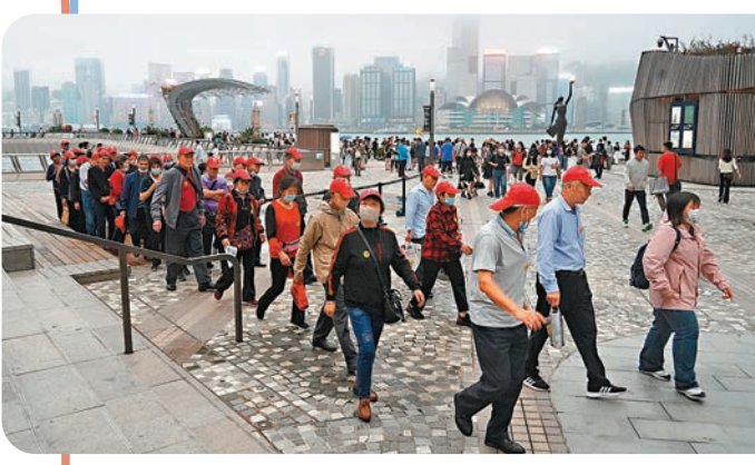
酒店貴團費升，加上接待能力不足，令本港入境團「吹淡風」。圖為內地旅行團在尖沙咀觀光。資料圖片