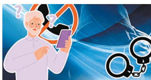
◆再有長者墮「假兒子」電話騙案，痛失40萬元。

香港文匯報訊（記者 蕭景源）警方上周四（20日）下午接獲一名85歲男長者報案，表示接獲有人冒充其兒子來電，聲稱因涉刑案被警方拘捕，急需40萬元作「保釋金」。疑犯其後以「兒子」朋友身份登門收取款項離開，直至事主兒子回家始揭發騙案。