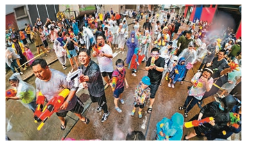
◆於荔枝角舉行的「香港潑水節2023」。

表演等，吸引逾15萬人次參與，為大家帶來「泰」開心的文化交流體驗！在之前的4月9日，經深水埗民政事務處協助，D2 Place一期及二期對出的長義街更封閉舉行了「香港潑水節 Fiesta」、「潑水節嘉年華」、「激FUN水戰派對」、「狗狗水戰派對」、「泰國暹羅道羅市集」、「泰靈市集」、泰國傳統浴佛儀式及動感豐富的音樂