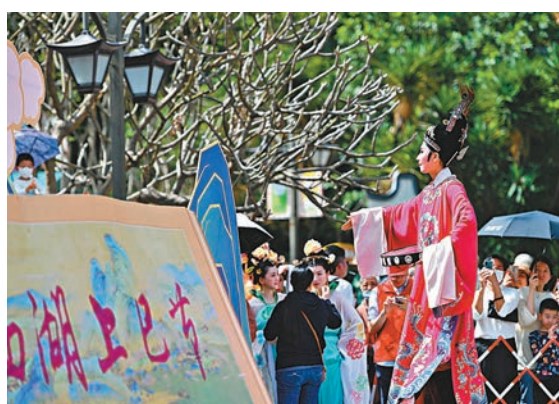
◆在福州西湖上巳節啟動儀式現場，福建閩劇院的演員在表演閩劇片段。

日前，2023年福州西湖上巳節啟動儀式舉行，今次福州西湖上巳節由即日起持續至4月30日，活動期間，市民遊客可在西湖柳堤處的百米「詩詞大道」感受「一步一景」；夜幕降臨，在流光溢彩的詩詞燈下感受古典園林的浪漫；還可以穿漢服、提燈夜遊、逛古風雅肆、賞古風表演，暢享無限樂趣。其實，上巳節俗稱三月三，是漢民族傳統節日，人們結伴去水邊沐浴，稱為「拔禳」，此後又增加了祭祀宴飲、曲水流觴、郊外遊春等內容。近年來，福州西湖公園逐步開始恢復上巳節傳統文化習俗，深受廣大市民遊客喜愛。