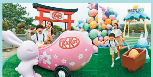
◆KIT KATQ版櫻花開蓬車。 ◆巨型彩蛋塔。

活力的氣氛！雖然復活節已過，但這座以朱古力為主題，於昂坪市集團形廣場設置有七彩繽紛的復活蛋砌成的3.5米高巨型彩蛋塔，活力十足的兔子攀上彩蛋塔大玩Egg Hunt，旁邊設有KIT KAT日式鳥居靚靚，讓人家現在也能輕鬆拍出充滿日系感覺的傳統鳥居照；同場亦有全港獨家的KIT KATQ版櫻