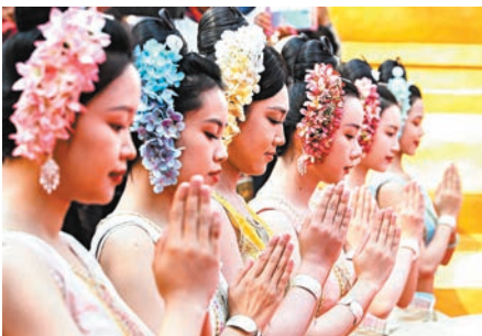
◆潑水節少不了美女跳舞祈福。

日前，在雲南省西雙版納傣族自治州舉行的傣曆新年取水儀式及潑水狂歡，場面熱鬧，數萬名各族群眾和遊客在景洪市用相互潑水的方式互送祝福、傳遞歡樂。當中，傣族姑娘在雲南景洪市瀾滄江畔取「聖水」，亦有傣族少女在取水儀式上灌「聖水」。