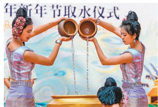
◆在景洪市瀾滄江畔，兩名傣族少女在取水儀式上灌「聖水」。