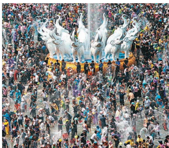
◆景洪市潑水廣場大象噴水有氣勢。