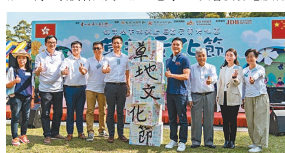
◆黃大仙區舉辦了疫後首個大型戶外嘉年華。