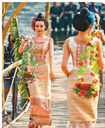
◆傣族姑娘在瀾滄江畔取「聖水」。