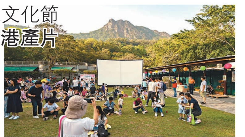
◆在獅子山公園的草地上安排電影放映晚會「星光影匯」。

大會於公園草坡前架設舞台，邀請多隊社區青年樂隊及黃大仙區小學派員前來表演，隊伍包括樂隊 Sparkles、樂隊 Hody-Listen、獨立表演者天昊 Alan、屯馬