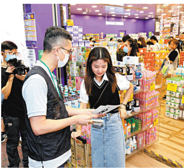
◆深圳王小姐讚揚海關派傳單講解消費權益令旅客消費更有保障。香港文匯報記者鄺福強攝。