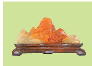
■CARLOSPRATA 英國 18世紀 壽山石雕人物 垂釣圖字筆山