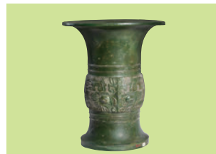
■Koller Auktionen AG 瑞士開樂 商/西周 青銅尊