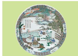
■DORE & REES 清康熙 五彩碟