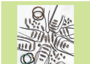
■十七天珠 千年老天珠