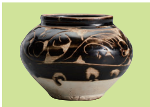
■映雪堂 金代 磁州窯黑釉剔花罐