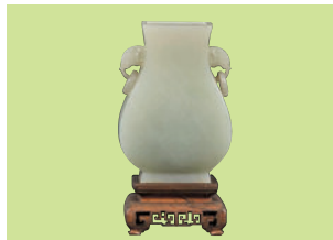
■芬蘭奇寶齋 清18世紀 青白玉 象耳活環方尊