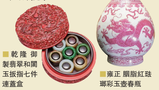
■乾隆 御製翡翠和闐玉扳指七件連蓋盒 ■雍正 胭脂紅珪瑯彩玉壺春瓶

再回顧首輪春拍，香港蘇富比本季50周年拍賣，近20場現場拍賣總成交額達37億元。其中「神超形越」專場成交總額9千300萬多萬元；「玲瓏雅趣」專場成交總額4千595萬多萬元；「中國藝術珍品」專場成交總額5億3千430萬多萬元。香港蘇富比是次春拍除了4件突破億元的拍品外，其他的成交也不俗，有14件拍品逾千萬元售出。其中成交價最高的兩件，俱為清帝御製之器。首先是7枚乾隆御製的翡翠和闐玉扳指，連同剔紅漆盒，近6千500萬元易主。其次是雍正胭脂紅珪瑯彩玉壺春瓶，以6千034萬元成交。另外，乾隆御寶和闐青玉交龍鈕璽，也以4千885萬元成交。其他逾千萬元的成交：西漢金羽人2千525萬元、唐石灰岩雕寶冠佛首1千886萬元、雍正門彩雞缸盃1千497萬元、明宣德青花魚藻紋葵花式洗1千497萬元等。