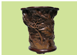
■政賢堂 清18世紀 黃楊木雕 亭台樓閣筆筒