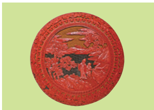
■Ho Ho Gallery 清乾隆 剔彩人物花卉圓盒

地點：香港會議展覽中心展覽廳5G 地址：香港灣仔博覽道一號(舊翼) 貴賓預展：2023年5月26日(星期五) 6:00-9:00pm 公開展覽：2023年5月27-29日(星期六至星期一) 11:00am-7:00pm 2023年5月30日(星期二) 11:00am-5:00pm