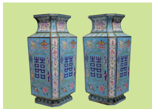
■寶瑩號 清18世紀 銅胎畫琺瑯 八寶紋「龍」字八角瓶一對