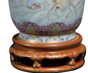
■永寶齋 乾隆 洋彩八仙過海圖燈籠尊「大清乾隆年製」款