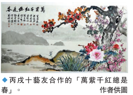
◆丙戌十藝友合作的「萬紫千紅總是春」。

有感到十友聯袂展藝，筆者作「蝶戀花」一闕：碧綠江南山水妙，烈焰紅棉，隔樹聞啼鳥。一曲陽春林間聽。凌雲擁日三環抱。蝶舞翩跹相挽俏，花落花開，自覺人低調。何事霜華催鬢老。