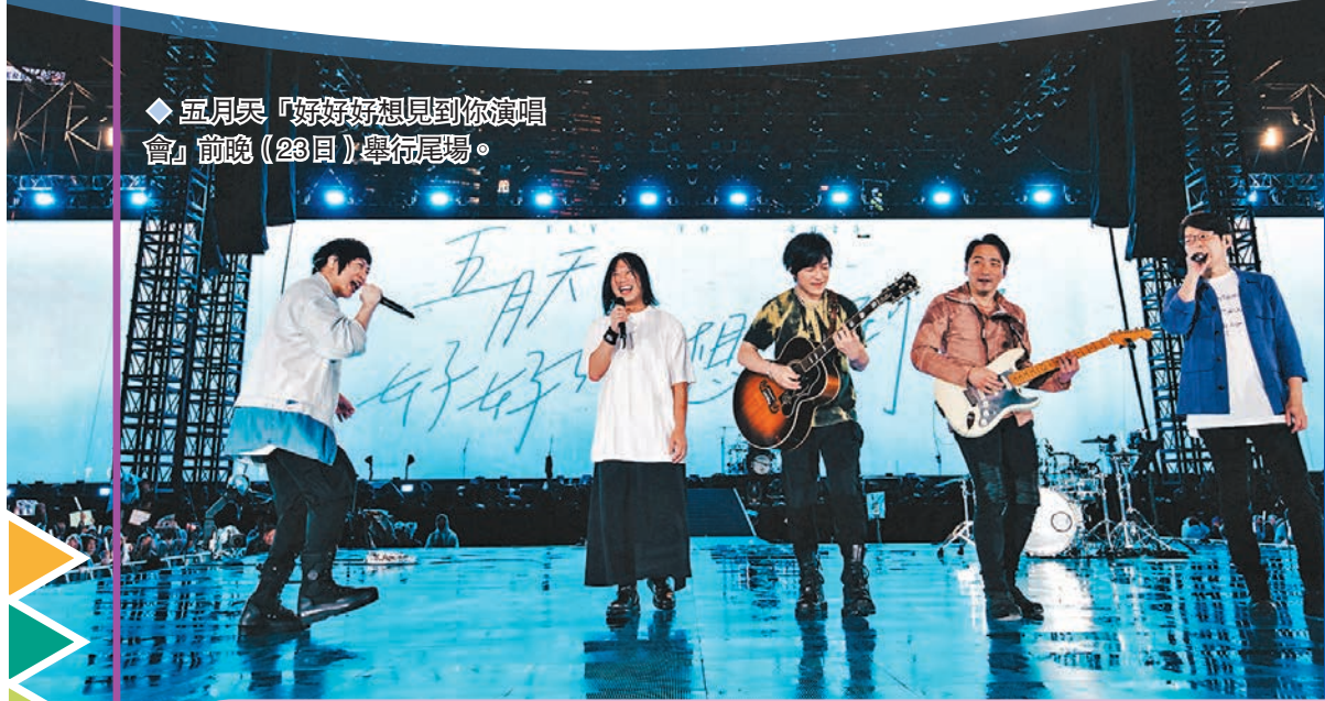
五月天「好好好想見到你演唱會」前晚(23日)舉行尾場。

香港文匯報訊(記者子棠)台灣樂隊五月天在港舉行的6場《好好好想見到你演唱會》圓滿落幕,前晚(23日)在中環海濱活動空間唱完最後一場,5位成員阿信、怪獸、石頭、瑪莎、冠佑都大感不捨,石頭和怪獸更即興除衫赤裸半身給粉絲「派福利」。