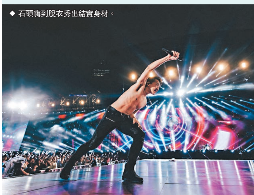
石頭嗨到脫衣秀出結實身材。

尾場一如慣例,五月天甫出場即引全場哄動,台下紛紛站起身揮動熒光棒一同跳唱,而五位成員亦談及此行在港逗留了兩個星期的感受。首先是石頭自爆這段時間有出外吃東西,但沒戴口罩也沒被人認出來,笑談估計可能是五月天很久沒來香港,大家已把他們忘記了;而怪獸就指由於4年沒來香港,因此做了很多事,包括跟老友見面及到主題樂園玩,笑言雖然近年記憶力變差,但一定會記得此行。