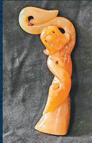
◆即便玉舞人也不扭臀