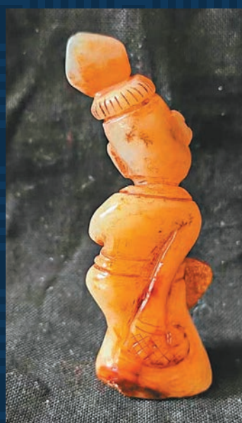
◆玉舞人採用曲線的美感