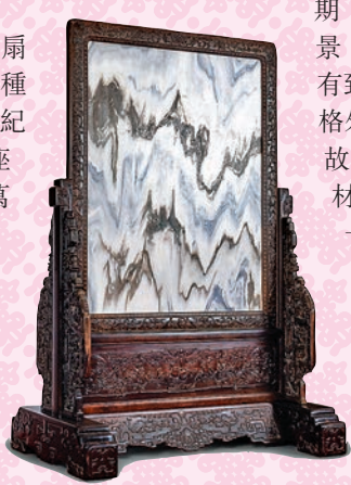
◆清紫檀插屏式座屏風