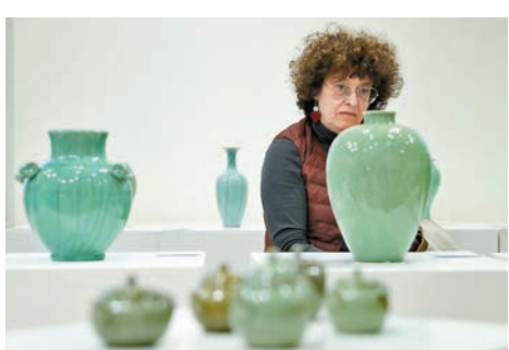
◆參觀者在「聽瓷語 觀世界——宋韻龍泉青瓷展」上觀賞瓷器。

明代就傳入歐洲並得名「雪拉同」(Celadon)的中國龍泉青瓷今月初回到歐洲，「聽瓷語 觀世界——宋韻龍泉青瓷展」在布魯塞爾中國文化中心拉開帷幕，55件由龍泉當地藝術家和手工藝人設計燒製的青瓷作品將與比利時公眾見面，為號稱「歐洲心臟」的比利時添一抹溫潤如玉的青綠。