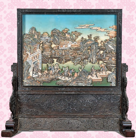
◆清乾隆御製紫檀嵌彩繪象牙學士遊樂園插屏