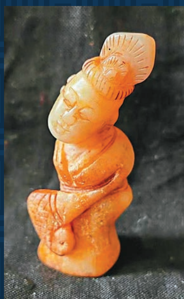
◆玉舞人舞姿反映民族融合

中國文明不僅超過五千年，而且是世界四大古文明中唯一沒被割斷的。應該說華夏各民族長期的，與時俱進的文化自信文化交流是其重要原因之一。筆者在拙著《祖源記憶》書中指出，古代中國的中原「諸夏」與周邊「四夷」，在血緣與文化上經過不斷的相互融合，將各自原有的分散的血緣紐帶，昇華為一個共同的祖源記憶，集成一種全民的文化認同與心理凝聚力。多元一體