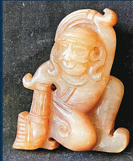
◆胡人翹屁股的舞姿傳至華夏中原