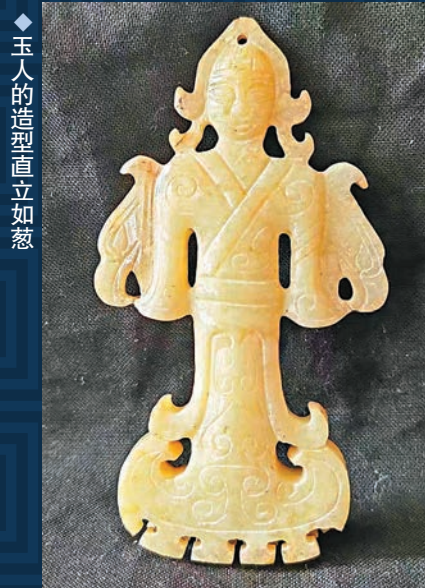
◆玉人的造型直立如葱

玉舞人是一種以女性為形象的裝飾品，基本上為長袖、折腰翩翩起舞的女性，也有七盤舞、巾舞等多種舞姿。這些玉舞人最早出現於戰國時期，但在漢代達到了巔峰。玉舞人所刻畫的是女樂形象，在中國古代的宮廷享樂中，女樂表演佔據了重要的地位，貴族們為了滿足自己的需求，還設立了專門的機構來培訓女樂伎。早期的女樂表演是以長袖舞為主，但漢代之後，七盤舞、巾舞等形式也開始流行起來。漢人對這些舞蹈非常喜愛，取材這些造型製作出許多玉製的舞人佩飾。這些舞人佩飾多出於諸侯親屬等墓葬之中，成為了供貴族享樂的女樂的象徵。除貴族外，官廷和諸侯富商也紛紛養女樂，以彰顯自己的權力和富裕。這些玉舞人不僅展現了漢代女性的優雅舞姿，也反映了當時的社會風貌和文化價值。