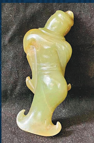
◆翹屁股作為一種美感