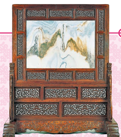
◆十七世紀大理石、黃花梨及鐵力木座屏