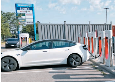
◆政府在各處建約3.5萬個汽車充電站，但遠不足應付需求。

渥太華強調，汽車製造商或進口商若在指定期限內未達到銷售目標，可能會遭到當局根據環境保護法通過的分階段措施處罰。鼓勵使用電動車的卑利組織 Plug'n Drive表示，政府必須盡速加建充電基礎設施和提供具吸引力的購買電動車回贈獎勵，否則消費者不會貿然轉用售價較高且使用時不方便的電動車。銷售商指出電動車的基礎設施若無法支持不斷增長的使用者，消費者必定望而卻步。