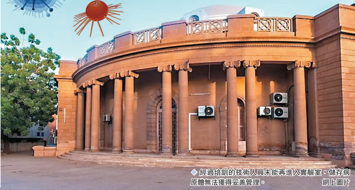
◆經過培訓的技術人員未能再進入實驗室，儲存病原體無法獲得妥善管理。