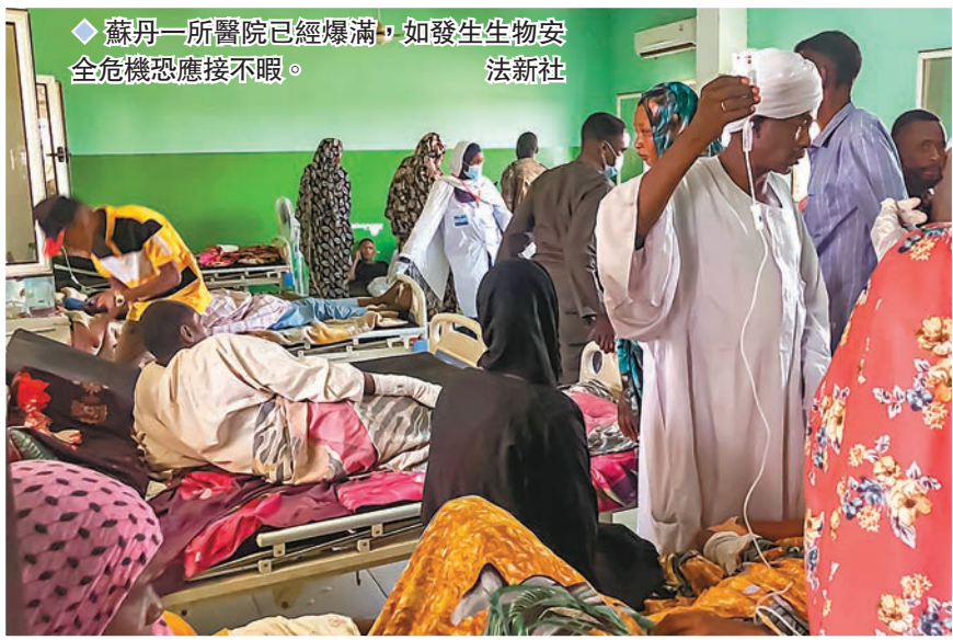
◆蘇丹一所醫院已經爆滿，如發生生物安全危機恐應接不暇。

聯合國警告，首都喀土穆估計有21.9萬名孕婦，預計未來幾周內，有2.4萬人將在幾乎沒有醫療服務的情況下分娩，情況令人憂慮。世衛截至前日的數據顯示，自4月15日以來，蘇丹武裝衝突造成至少459人死亡、4,072人受傷。