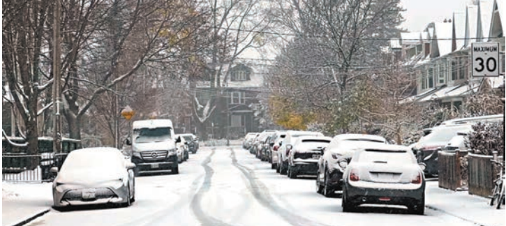
◆車主對電動車電池能否承受嚴冬極端天氣存疑慮。