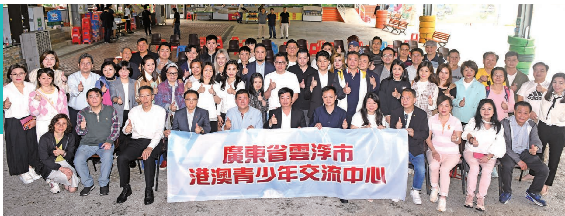
◆廣東省雲浮市港澳青少年交流中心揭幕儀式，雲浮市、中聯辦、港澳辦等領導和主禮嘉賓出席儀式。