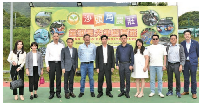
◆雲浮市代表一行參觀沙頭角農莊

雲浮毗鄰珠三角核心區，是粵港澳大灣區通往大西南的「橋頭堡」，交通区位优势獨特，生態環境優良，與港澳地緣相近、人緣相親，歷來非常重視與香港、澳門的合作，在經貿交流、科技創新、教育等領域合作淵源已久。雲浮現有累計港澳台及外資企業459家，一直以來，鼓勵港澳台僑青年來雲創業，落實創業資助、創業擔保貸款、稅收優惠政策等政策措施，助力港澳優質專業發展。自2021年以來，雲浮充分利用歷史文化底蘊和當地特色產業，建設完善了一批港澳青少年交流基地，包括衍生集團和郁南江小鎮兩個港澳台僑青少年創新創業實習交流基地、廣東溫氏集團、廣東凌豐集團股份有限公司、惠能紀念廣場、禪城小鎮、象窩山生態園、天露山旅遊度假區等6個「雲浮市港澳台僑青少年交流基地」，並結合歷史古跡、紅色基地、鄉村振興示範點等優化研學交流路綫。同時依託「省級對台交流基地—雲浮新興禪文化兩岸交流基地平台」，雲浮承辦或協辦了暨南大學港澳台僑學生國情研習營活動等多次港澳台僑交流活動。打好「資源」牌，走好「創新」路。在加強雲浮市內港澳青少年交流基地同時，雲浮市也在積極探索以「內外聯動」的方式發揮和