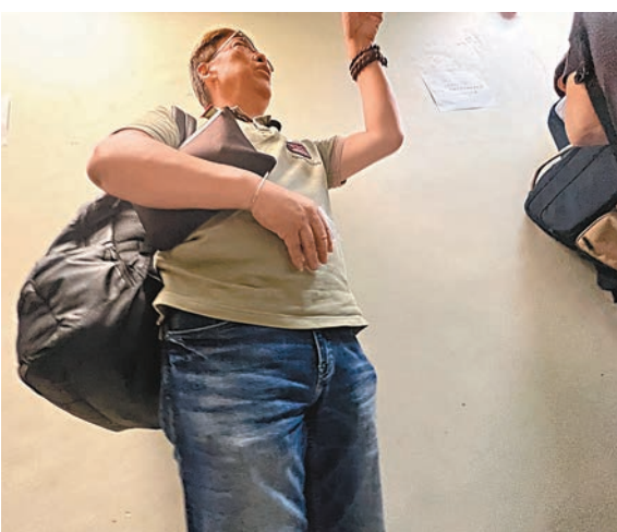
◆有排隊領取「禁區紙」的市民投訴：「至少要預一個月才能搞掂！」