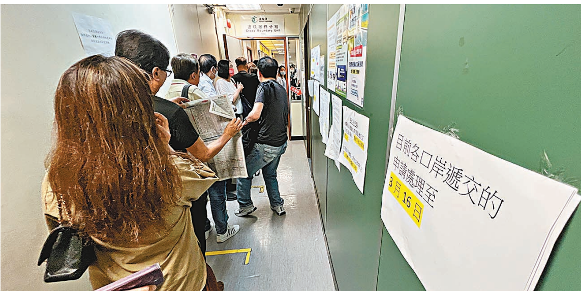
◆運輸署過境服務分組辦事處人山人海。

到本月14日，他再到香港辦理其他事務，並到運輸署過境服務分組「搏一搏」，沒想到公告顯示申請已處理至3月16日，其「禁區紙」日前就已辦妥，但未收到任何通知，他即場取籌及花3小時處理才成功領到「禁區紙」，其汽車可北上，之前預繳