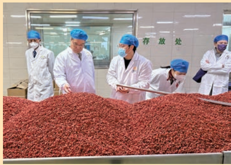
◆ 參觀北京同仁堂中藥飲片廠。