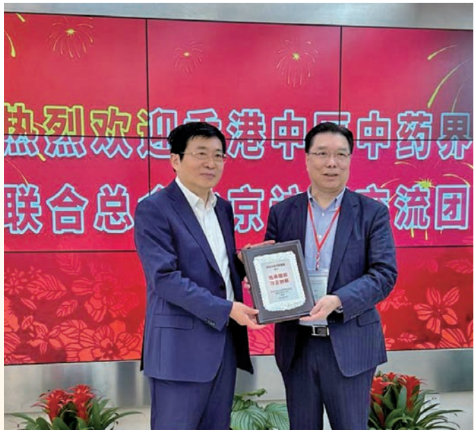
◆ 國家中醫藥管理局局長于文明（左）親自接待訪問團。