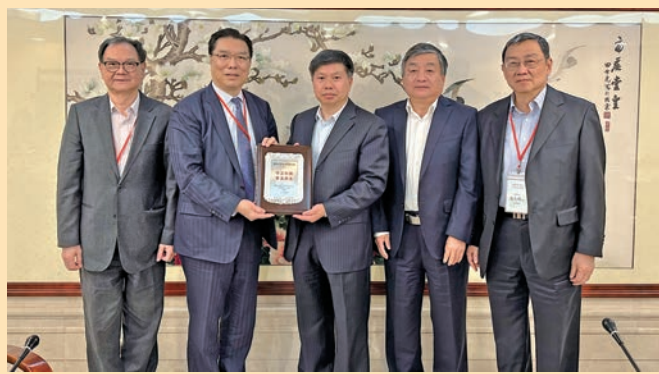
◆ 國家市場監督管理總局司長周石平（右三）及食審中心主任高峰（右二）接待訪問團。