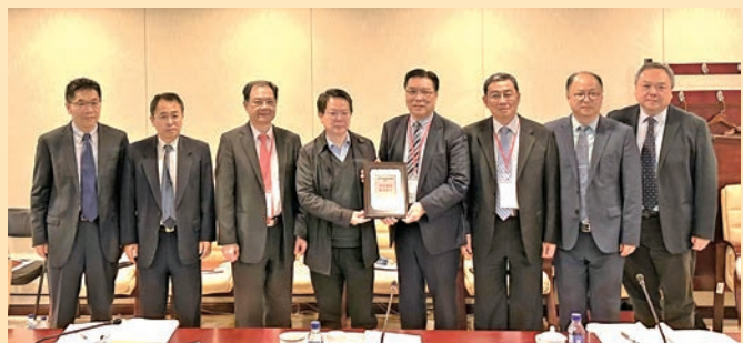
◆ 國家藥品監督管理局副局長趙軍寧（左四）、司長秦曉岑（左二）、副司長王海南（右二）、主任周思源（右一）與訪問團交流藥品註冊最新情況。