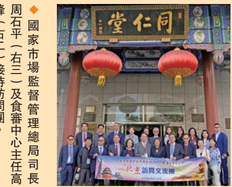
◆ 參觀北京同仁堂中藥門市部。