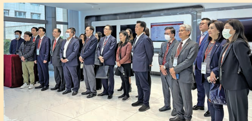
◆ 參觀全國人大代表工作信息化平台中心。