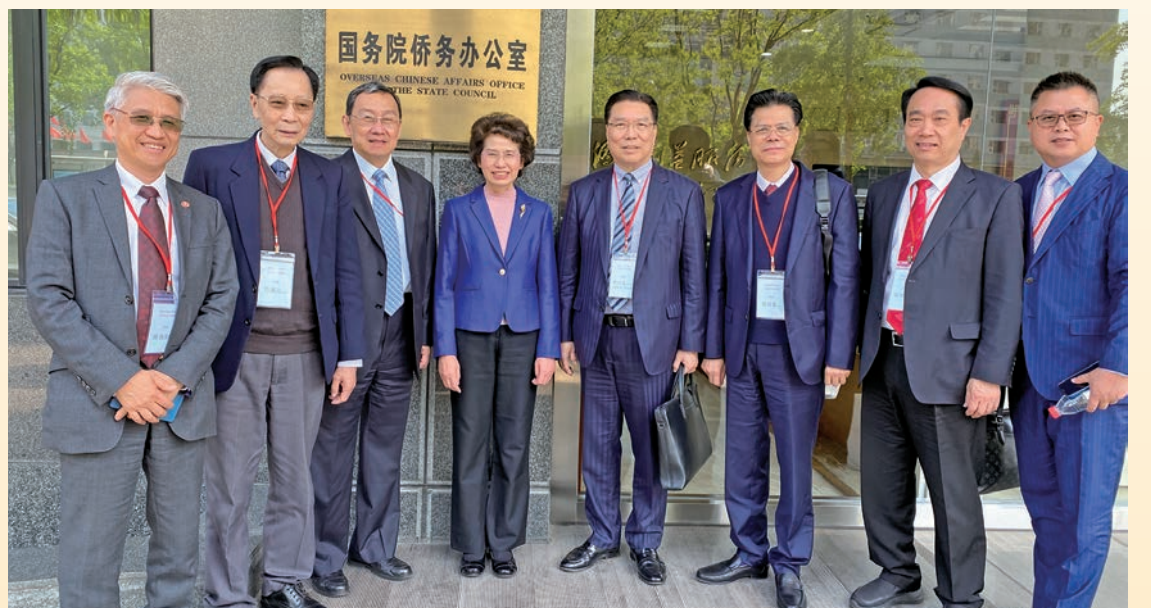
◆ 拜訪中央統戰部，三局一級巡視員單菊華（左四）接見。