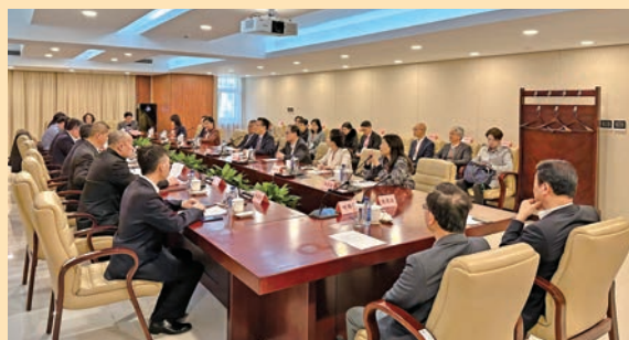
◆ 與國家市場監督管理總局進行保健食品註冊規管交流會議。