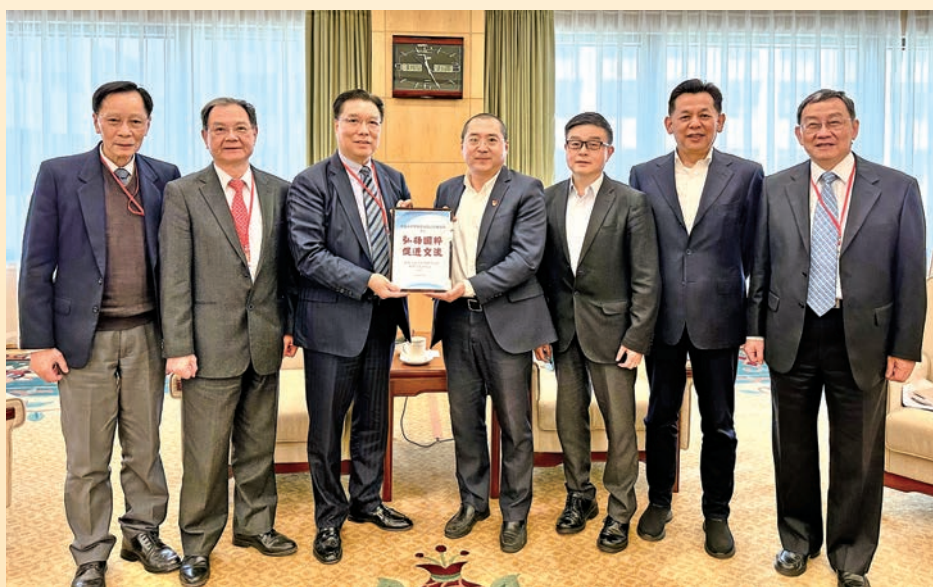
◆ 全國人大常委會辦公廳聯絡局局長傅文杰（右四）、主任陳佳林（右三）、副局長陳慶立（右二）一同接見訪問團。