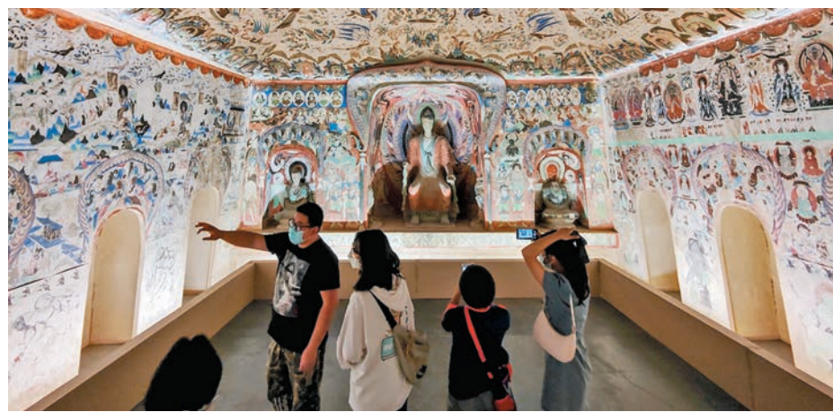
◆ 敦煌莫高窟曾出土大量寫本，具有極其珍貴的學術價值。圖為博物館建造的仿製莫高窟。資料圖片