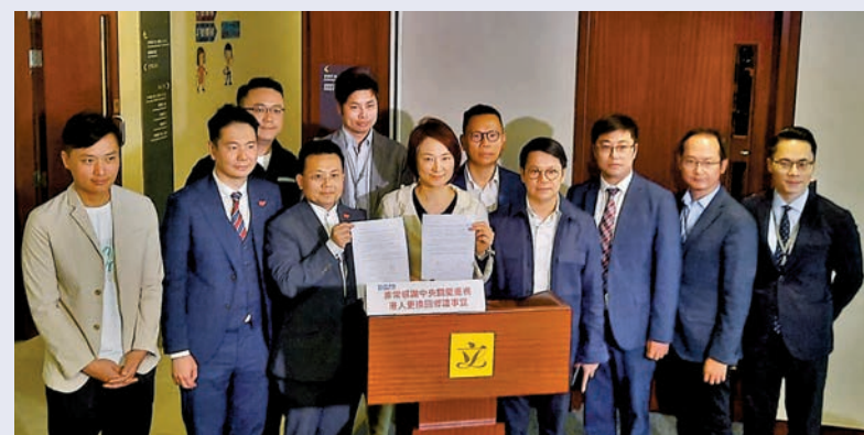
◆民建聯非常感謝中央關愛,重視港人更換回鄉證事宜。

境管理局及時推出有關措施,可滿足市民回內地探親、旅遊、公幹等需求,並紓緩辦證機構壓力,相信有助促進口岸人流往來。