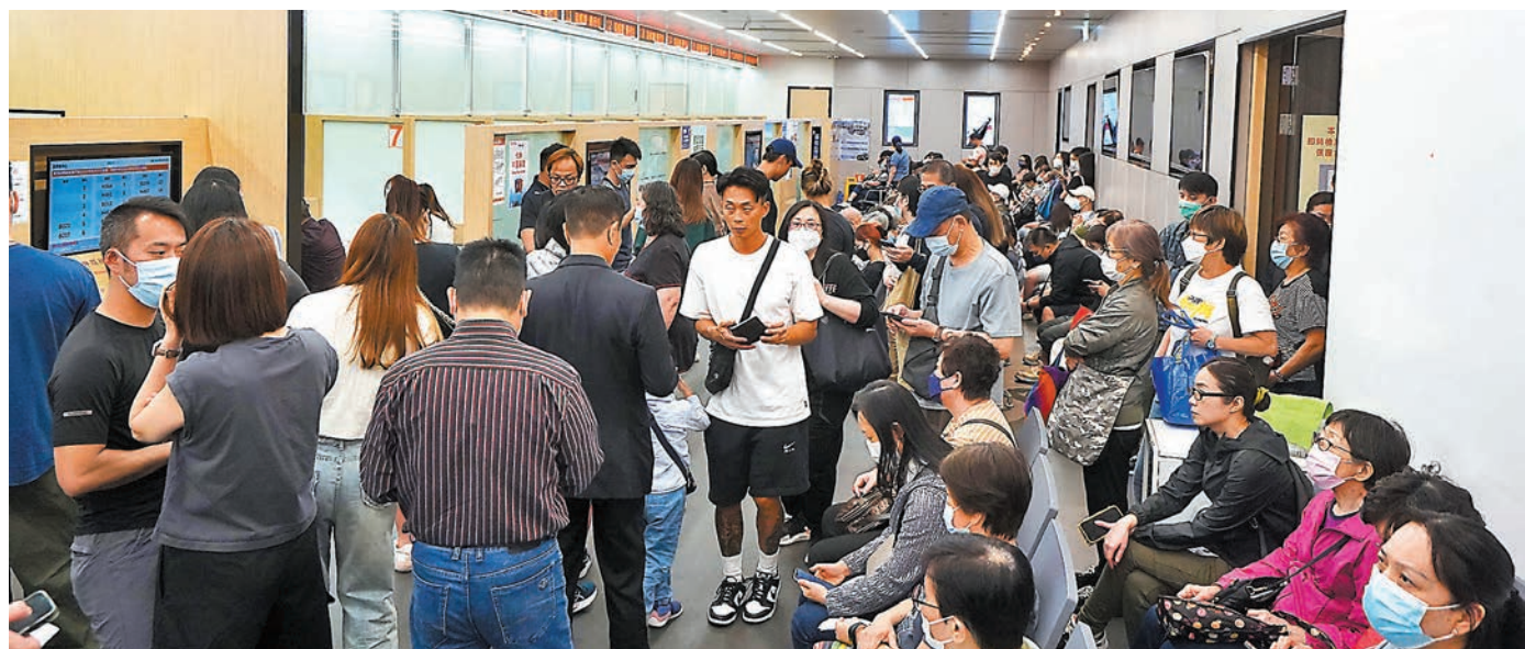
◆中旅社新界東證件服務中心昨日人頭湧湧。香港文匯報記者 曾興偉 攝

在香港與內地全面復常通關後,不少港人因未能預約換領回鄉證,一直無法北上內地探親、旅遊或公幹等,辦證高峰期一直居高不下,預約換領回鄉證更已排至9月,到換領中心換證的人潮源源不絕。葵涌的香港中旅證件服務九龍西中心昨日人頭湧湧,辦證櫃檯大排長龍,等候叫號的區域座無虛席,部分市民只能站在一旁輪候辦理手續。