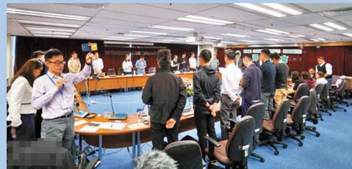
◆2020年，葵青區議會舉行會議期間，攬炒派議員唱「港獨」歌曲。資料圖片