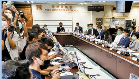
◆2020年，元朗區議會攬炒派議員打着所謂「止警誡」的標語，向與會的時任警務處處長鄧炳強「問罪」。