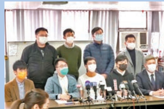
◆所謂「議政平台」籌委會舉行記者會。資料圖片