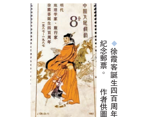
徐霞客誕生四百周年紀念郵票

據記載，明代著名地理學家、文學家和大旅行家徐霞客當年就是走觀音峽，沿麗江茶馬古道南線進的麗江。他在遊記中非常翔實地介紹了觀音峽及附近著名關隘邱塘關等地。公元1639年正月廿五日，徐霞客應麗江土知府(大土司)木增土司的邀請，從大理雞足山經鶴慶到麗江。他從鶴慶順漾江進了觀音峽，在西關村沿茶馬古道而上至邱塘山上的關卡，見此處山勢陡峭，地形險峻，不由驚嘆曰：「塢盤水曲，田疇環焉，其崖巖累，此山真麗郡鎖鑰也。」並留下珍貴的紀錄：「七里，乃漸轉西北，始見邱塘關在北山上。」