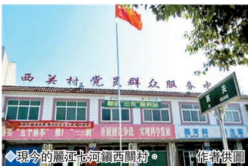
現今的麗江七河鎮西關村

邱塘關在納西族語中稱「敢古」。此關由一石門、三個院落組成，東邊二院，西邊一院，故當地人俗稱「三家村」。據《徐霞客遊記》及相關史料記載，邱塘關石門前曾有一對石獅子，高約兩米，頭朝南，雄踞關口。石獅口含繡球，可轉動但不能取出。當年木氏土司為了抵禦外來侵犯，還在邱塘關兩側用石塊累砌了一段小長城，並在此設兵營作為邱塘關戰略防禦系統的重要組成部分。木增土司時派其子守此地，設稅局，派稅官。小長城現在只剩下殘牆廢址，但這幾百年前的石牆依然沾