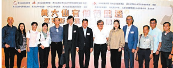
《黃大仙有個荷里活微電影製作課程》昨日舉行結業禮。