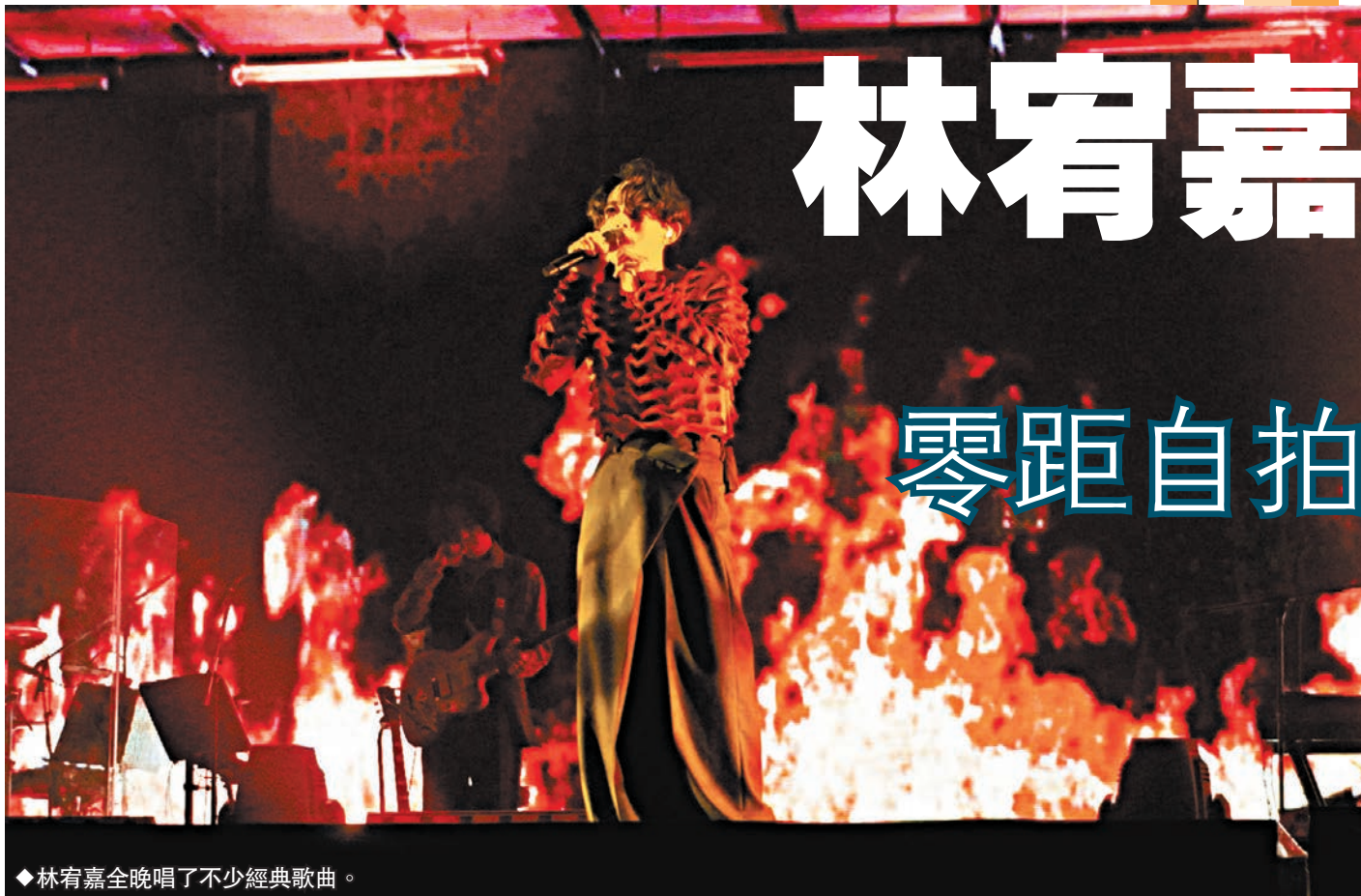
林宥嘉全晚唱了不少經典歌曲。

香港文匯報訊（記者 子棠）台灣歌手林宥嘉一連3場《idol 2023世界巡迴演唱會》前晚在紅館開鑼，吸引了馮允謙、林家謙、趙祥誠和趙增熹等圈中人捧場。闊別3年再度在港開唱，林宥嘉除了親任創意總監，大講廣東話，更跳唱到蹲身、趴地及翻地，名副其實地翻身演出；還大玩感性與自嘲，藉此與歌迷分享從轉化、昇華到明白愛的真諦。