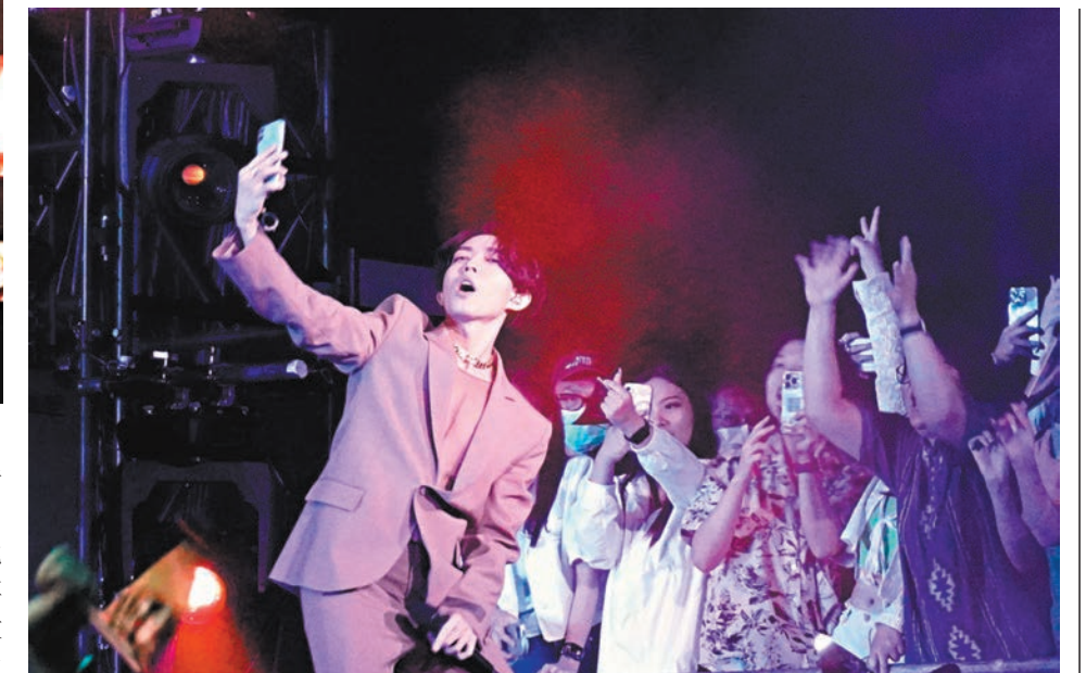
林宥嘉拿着歌迷的手機與歌迷玩自拍。