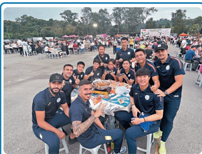
◆大埔球員出席球會就職禮及千人盆菜宴。