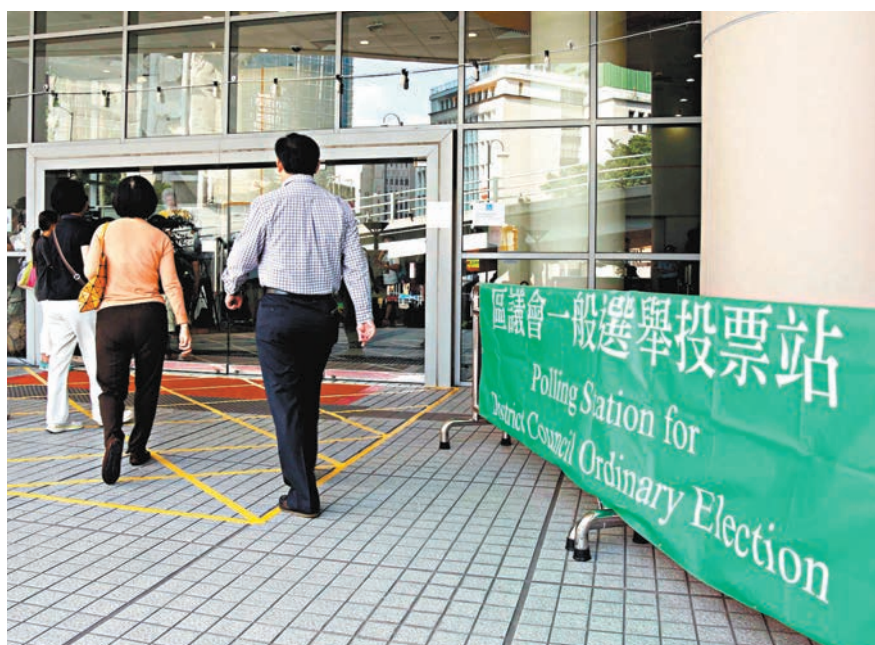
◆消息指來屆區議會極可能採取「直選、間選、委任」混合模式。圖為過往的區議會選舉，市民往票站投票。資料圖片

方針，確保憲法和基本法規定的制度有效及持久落實；二是全面落實「愛國者治港」原則；三是充分體現行政主導。 李家超並指，就區議會的職能和組成達成的結論有四：一是區議會作為地區行政和諮詢的重要一部分，值得保留；二是日後區議會產生辦法要符合基本法賦予的定位和職能，有多種方式並將保留一定選舉成分，讓愛國愛港而且有志服務地區的人士可透過多種渠道參與區議會的工作；三是來屆區議會的議席數目會與現屆議席數目（即479席）相若，讓區議會有效履行各項職能；第四，區議員的酬金和津貼大考慮維持不變，以支持區議員履行區議會的工作。