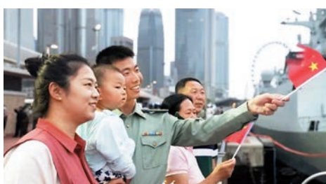
▲駐港部隊官兵和親屬觀看升旗禮。