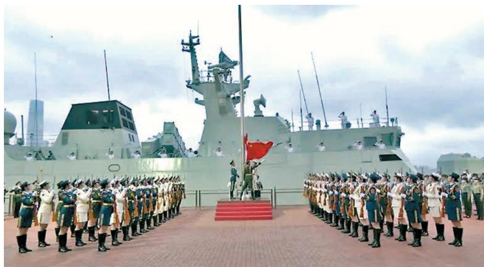
◆駐港部隊三軍儀仗隊在中區軍用碼頭舉行升旗禮。

香港文匯報訊 據駐港部隊微信公眾號「香江礪劍」消息，駐港部隊5月1日早上在中區軍用碼頭組織隆重升旗儀式，首次邀請來隊親屬和官兵代表一起參加，在慶祝節日、致敬勞動者的同時，激勵廣大官兵戮力同心、接續奮鬥，為維護香港長期繁榮穩定貢獻自己的力量。 清晨的維多利亞港，駐港部隊「宿遷艦」停靠在碼頭，艦上官兵分區列隊，碼頭上，駐港部隊官兵代表和親屬整齊列隊，等待儀式開始。早上5時47分，駐港部隊三軍儀仗隊昂首闊步從中環軍營護旗而出，隊員們精神抖擻、步履鏗鏘，向着中區軍用碼頭前進。 隨着國歌聲響起，陸海空三軍官兵面向國旗莊嚴敬禮，參加儀式的官兵親屬莊嚴肅立，目送五星紅旗在晨光中冉冉升起。 駐港部隊官兵親屬表示，自己是第一次來這裏參加升旗儀式，覺得特別震撼、特別自豪，尤其是對小朋友來講，這種愛國教育從小開始，讓他對軍人爸爸特別崇拜，長大也想像一名軍人。 據悉，這是駐港部隊第一次組織官兵親屬在中區軍用碼頭參加升旗儀式。五一假期期間，還將組織親屬參觀駐港部隊展覽中心，體驗軍營文化活動，感受部隊的熱情與溫暖。