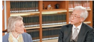
◆尤德爵士夫人跟何文匯教授在《世說論語》裏暢談中西文化的傳統價值觀。

包裝很重要，希望有更多的創意人才一起參與推動，確保它們不顯得落伍。因為這些價值觀是永遠青春和實用的。 包裝很重要，希望有更多的創意人才一起參與推動，確保它們不顯得落伍。因為這些價值觀是永遠青春和實用的。