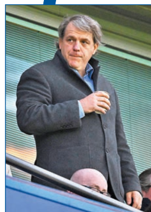
◆班主保利時常走入更衣室訓話的美式管理手法，令車路士球員感到不習慣。

香港文匯報訊(記者 楊浩然)英國傳媒日前報道，車路士目前內部問題之多，可能在今夏有新領隊加盟下仍未能作解決。