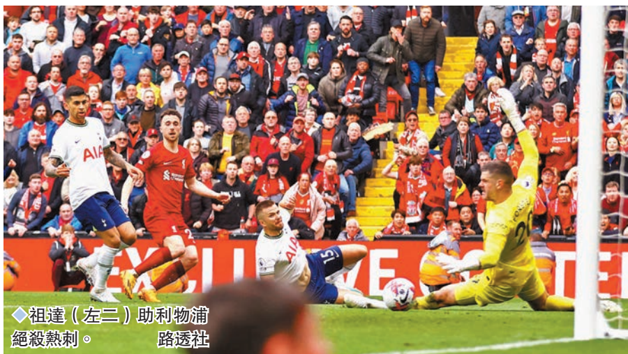
◆祖達(左三)助利物浦絕殺熱刺。