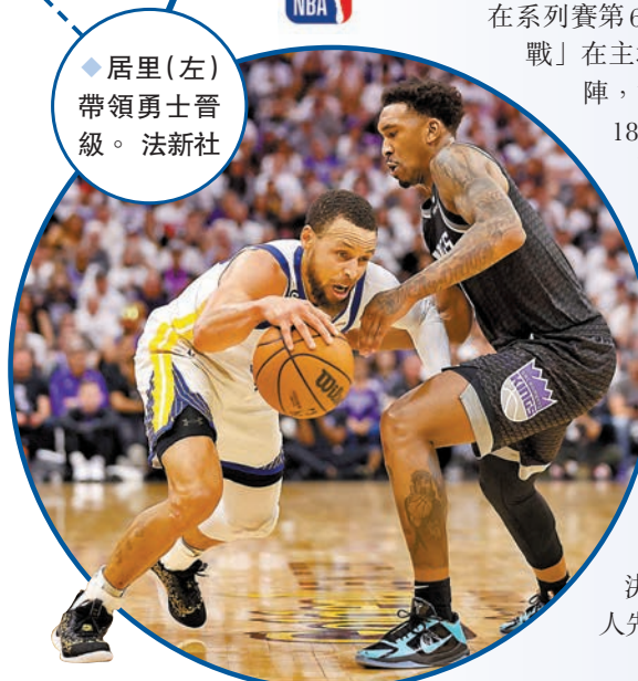
◆居里(左)帶領勇士晉級。

另一方面，熱火則於昨日的東岸準決賽首戰，作客以108:101擊敗紐約人先拔頭籌。