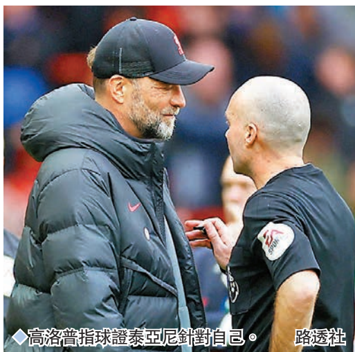
◆高洛普指球證泰亞尼針對自己。