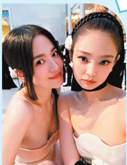
◆宋慧喬與年輕近 15 歲的 Jennie 合照也不遜色。

香港文匯報訊有「時裝界奧斯卡」之稱的 2023 Met Gala 在紐約大都會博物館登場，今年的主題是「Karl Lagerfeld: A Line of Beauty」，開宗明義為了紀念已故的 Karl Lagerfeld。