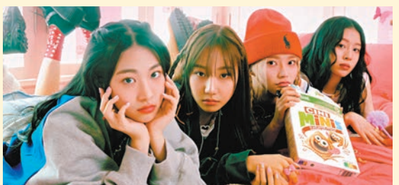
◆ FIFTY FIFTY 的歌曲打入 Billboard HOT100，超越 BLACKPINK。

今次新歌同時推出英文、韓文版本，令到 FIFTY FIFTY 在外地爆紅，成為影片平台熱搜組合，成員 Aran 就希望去海外與粉絲見面：「今次歌曲有兩個版本，我覺得兩首歌形式都唔同，大家可以期待新嘅音樂。如果大家有機會都想同香港嘅藝人合作，可以傾吓點 Cross Over！另外，我想多謝團隊，令我們嘅音樂回歸韓國樂壇。」