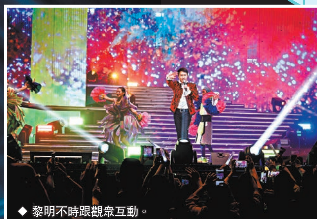
◆黎明不時跟觀眾互動。