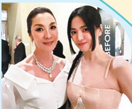
◆宋慧喬(右)喜與楊紫瓊再碰面。網上圖片

今年的時尚盛事中，有更多的亞洲臉孔受到高度關注，剛憑《黑暗榮耀》奪下韓國百想藝術大賞最佳女主角的宋慧喬首次受邀出席。她在會場上也與奧斯卡首位亞裔影后楊紫瓊及 BLACKPINK 成員 Jennie 碰面兼合照，三大「女神」合影引起網友關注，有網友發現其實宋慧喬與楊紫瓊早在 15 年前就已經相識，挖出當年二人的合影，如今兩人都是天后等級，成為會場亮點之一。