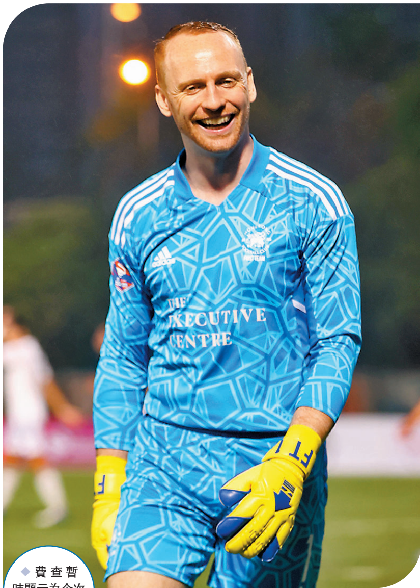
◆費查暫時顯示為今次投票票王。

今屆香港足球明星選舉設有17個獎項，包括香港足球先生(1名)、最佳教練(1名)、香港足球明星十一人(11名)、最佳青年球員(2名)、最受球迷歡迎球星(1名)及球員之星(1名)，得獎名單將於下月23日揭曉。網上投票時段由上月21日開始，至30日晚上11時59分結束。