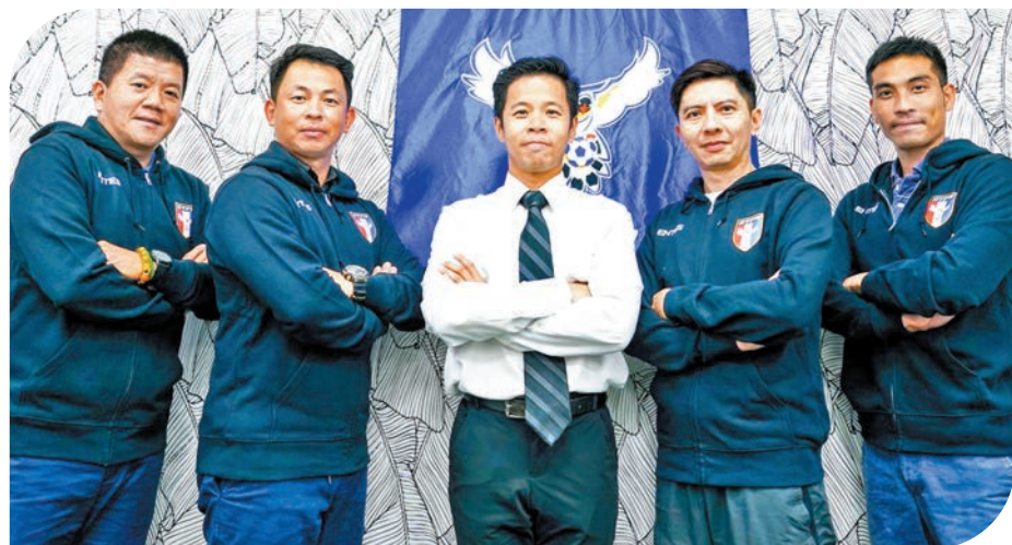
◆陳曉明(右二)將執教中國台北女子代表隊。

中國台北女足去年在亞洲盃8強止步，未能殺入前4名直接出線女子世界盃，之後再在附加賽被巴拉圭淘汰。陳曉明上任目標就是要帶隊出線世界盃決賽周，他也視之為職業生涯一大挑戰。