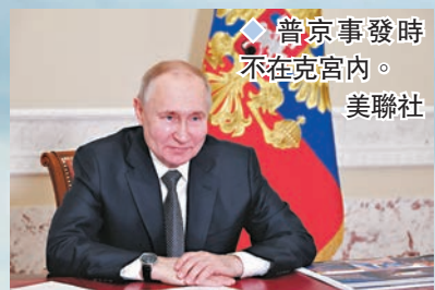
▲普京事發時不在克宮內。

香港文匯報訊 俄羅斯總統新聞局昨日發布消息說，烏克蘭當天凌晨企圖使用兩架無人機對俄羅斯總統官邸克里姆林宮發動襲擊，企圖暗殺總統普京，但被成功攔截。烏克蘭總統辦公室顧問波多利亞克否認烏方發動襲擊。