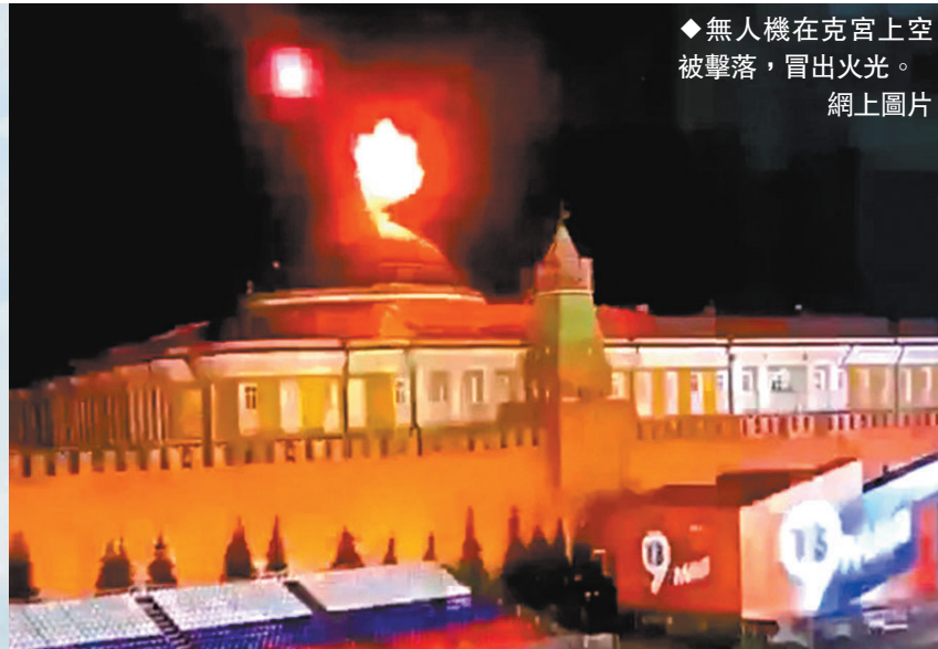
◆無人機在克宮上空被擊落，冒出火光。

據烏克蘭《真理報》昨日報道，烏克蘭總統新聞秘書尼基福羅夫當天表示，就無人機襲擊事件，烏方沒有可提供的相關信息，並說烏總統澤連斯基已反覆表示烏方所有武裝力量將用於收復自身領土而無意攻擊他國。