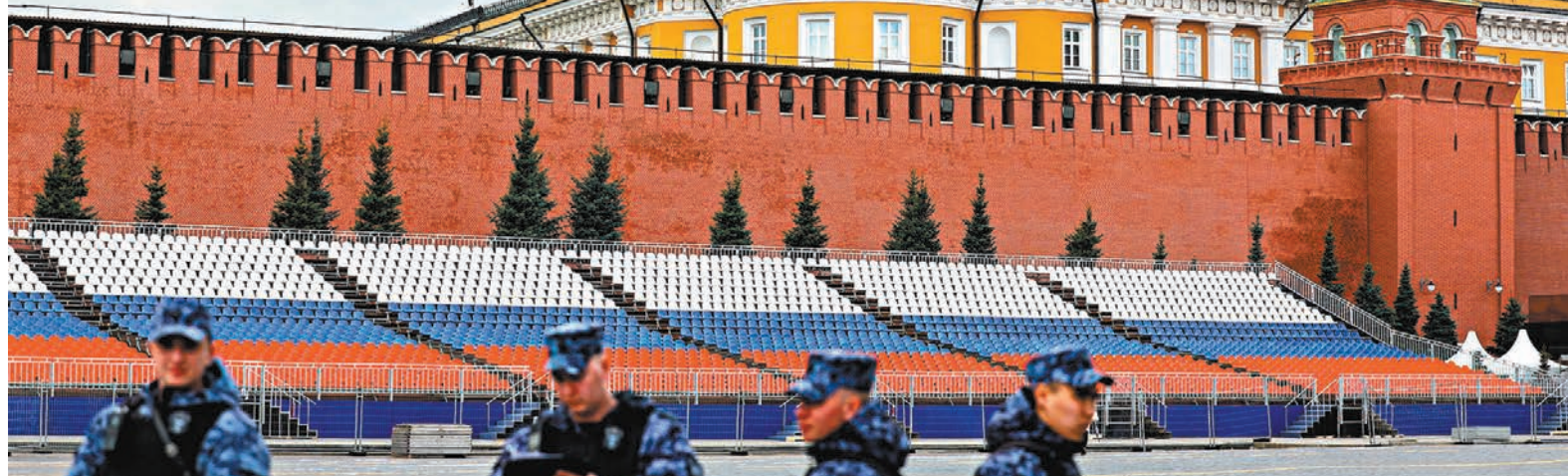
▲克里姆林宮外加強警備。