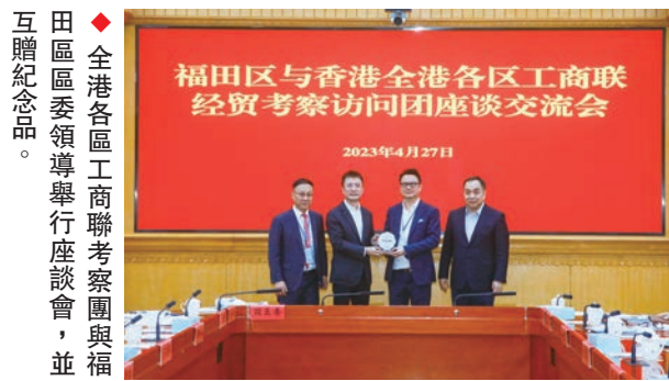
◆全港各區工商聯考察團與福田區區委領導舉行座談會，並互贈紀念品。