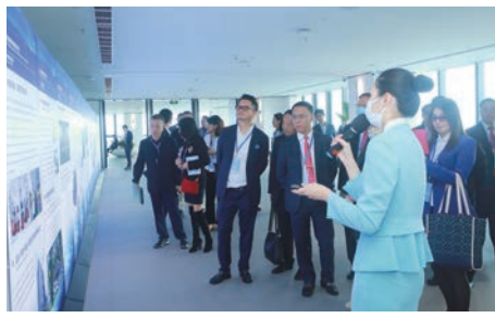
◆福田保稅區工作人員為考察團講解河套區發展情況。