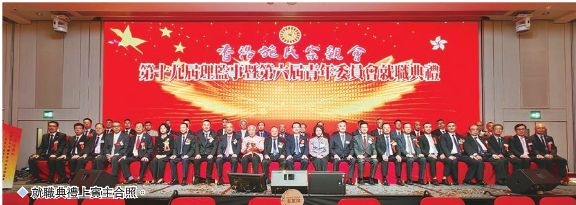
◆就職典禮上賓主合照。

此外，宗親們始終堅守愛國愛港立場，傑出宗長曾出任港事顧問，為香港順利回歸，為香港全面準