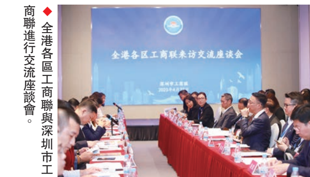
◆全港各區工商聯與深圳市工商聯進行交流座談會。